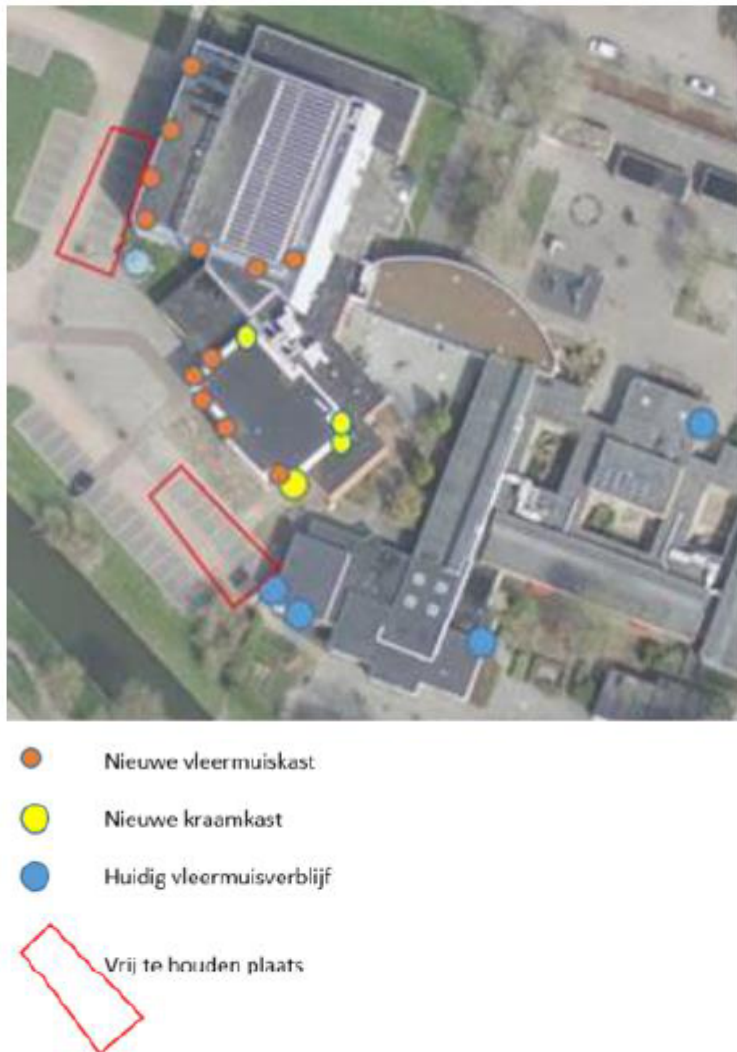
Figuur 2. Locatie van de tijdelijke voorzieningen. De locaties van de drie Vivaro Pro kraamkasten staan hier niet op weergegeven.