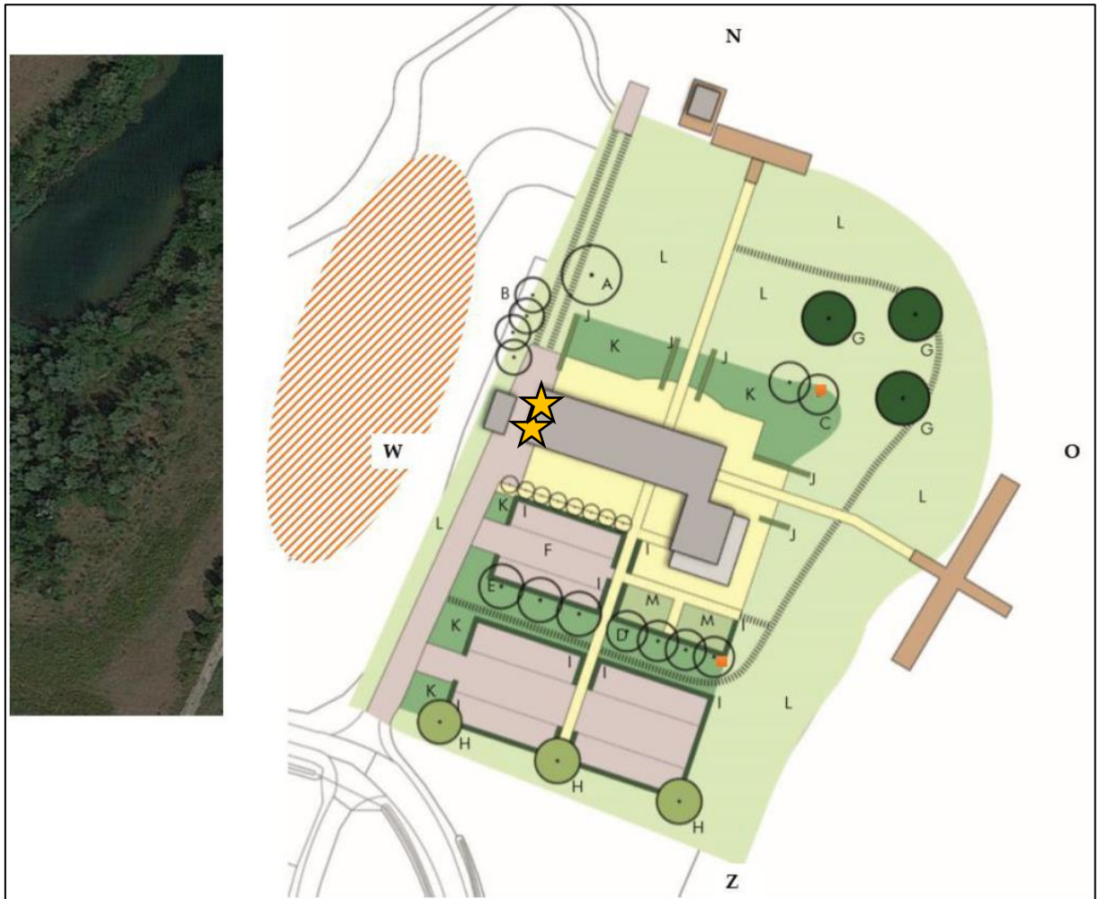
Figuur 3. Locatie van mitigerende maatregelen ten gunste van de kerkuil. Locatie van de kerkuilnestkast in de eikenboom en essenboom op de planlocatie (oranje stip). In het gebied ten westen van de planlocatie (oranje gearceerd) zal nog één kast in een boom geplaatst worden. Links is een uitsnede van de luchtfoto met daarin de huidige situatie in het oranje gearceerde gebied. Tevens wordt één kerkuilnest geplaatst in de kapschuur op de locatie Kerkeveld 10 te Beers (op circa 600 meter ten noordoosten van het projectgebied). Tevens worden twee inbouwvoorzieningen geplaatst in de westelijke kopgevel van de schuur (oranje ster).