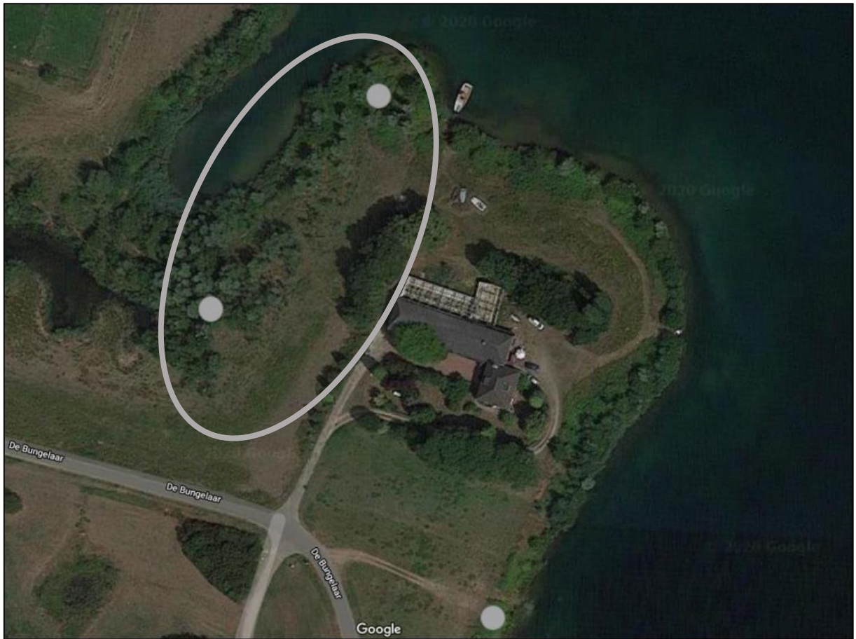
Figuur 7. Locaties voor de drie (tijdelijke) marter-takkenhopen (grijze stippen). Daarnaast worden twee duurzame steenmarterkassen geplaatst (globaal zoekgebied: grijze cirkel).