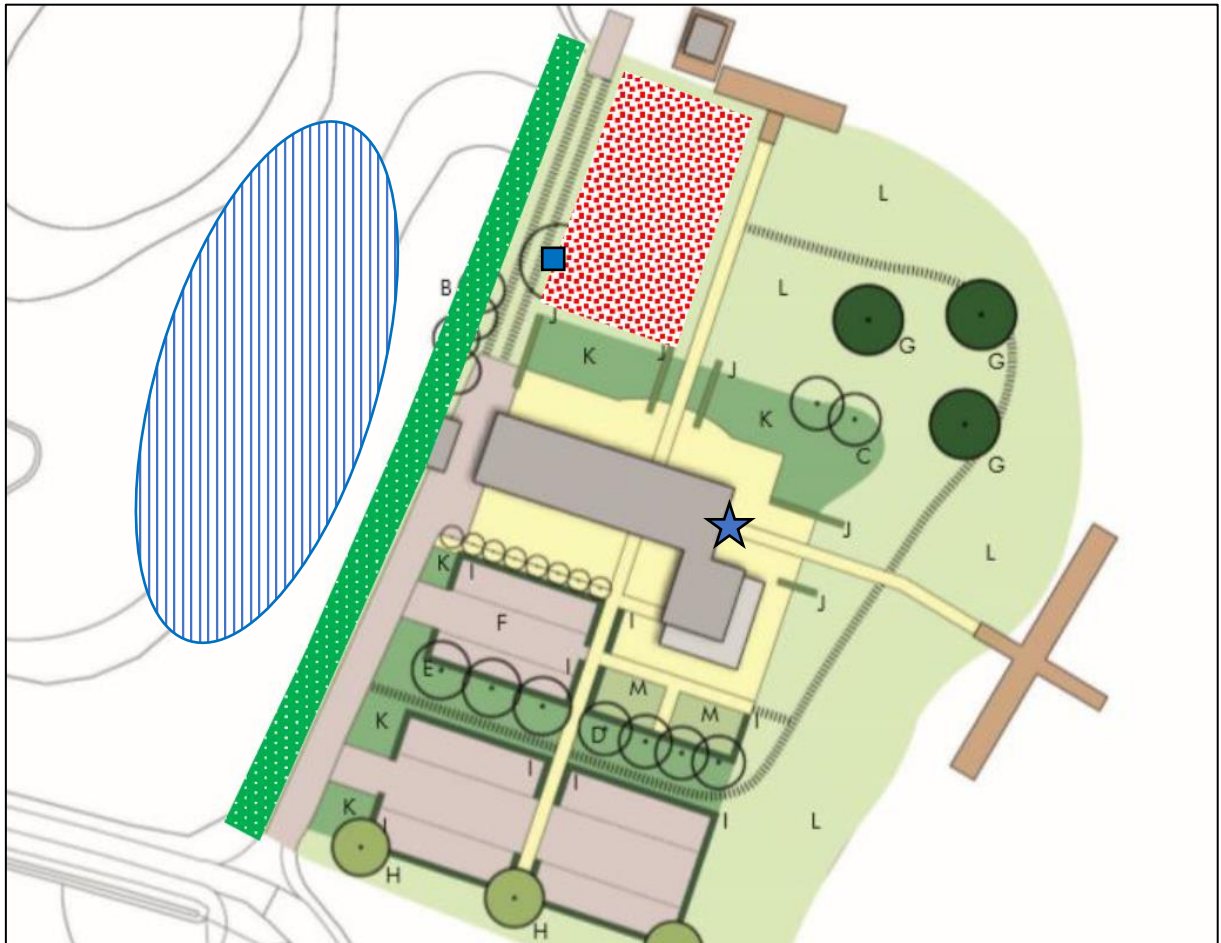
Figuur 2. Locatie van mitigerende maatregelen ten gunste van de steenuil. Locatie van de steenuil nestkast in de wilgenboom (blauwe stip) en het gebied waarin de tweede kast geplaatst zal worden (blauw gearceerd). Tevens wordt een inbouwvoorziening (uilenbord) geplaatst in de oostelijke kopgevel van de schuur (blauwe ster). Ten gunste van het leefgebied wordt een hoogstamfruitboomgaard aangeplant (rood gearceerd) en/of wordt een natuurlijke haag aangeplant (groen gearceerd), daarnaast worden losse fruitbomen (H) aangeplant en wordt bloemrijk grasland (L) gerealiseerd.