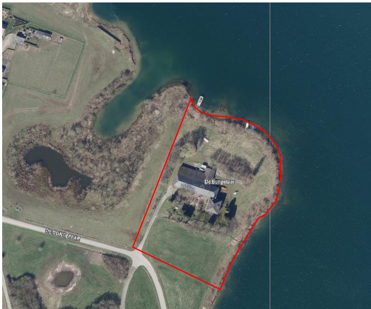
Figuur 1. Locatie De Bungelaar 4 te Beers. De activiteiten vinden plaats binnen het omliggende gebied.