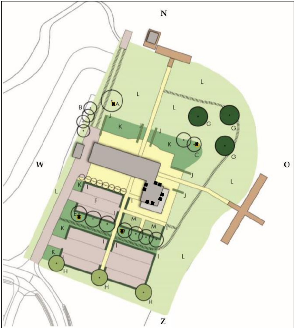
Figuur 4. Globale locaties voor de tijdelijke vleermuiskasten (zwarte vierkante blokken) ter compensatie van paarverblijfplaats en zomerverblijfplaats van de gewone dwergvleermuis.