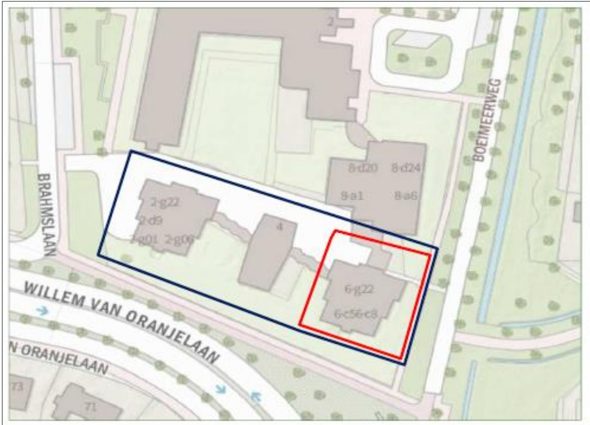
Figuur 1. Locatie van de te slopen zorggebouwen deel uitmakend van zorgcomplex Ruitersbos, Brahmslaan 6 B-G, 4837 AG te Breda. De activiteiten vinden plaats binnen het donkerblauw omliggende gebied en de (massa)winterverblijplaats bevindt zich in het rood omliggende gebouw.