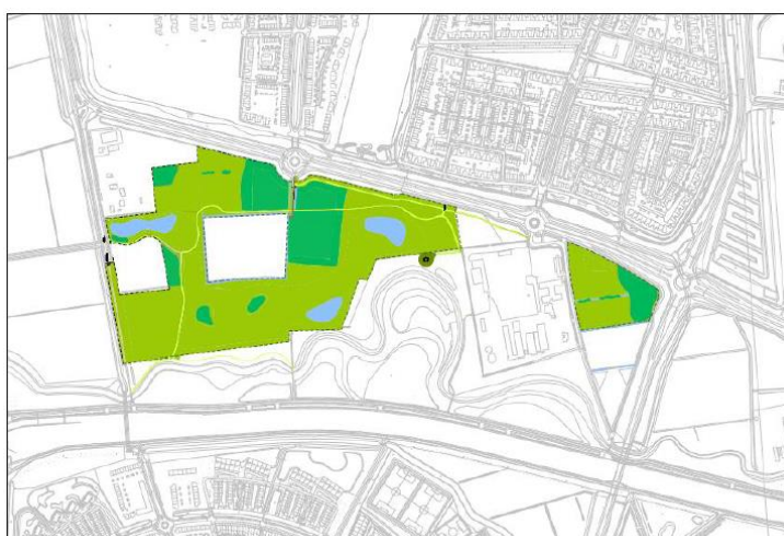
Figuur 3. inrichting Kanaalpark