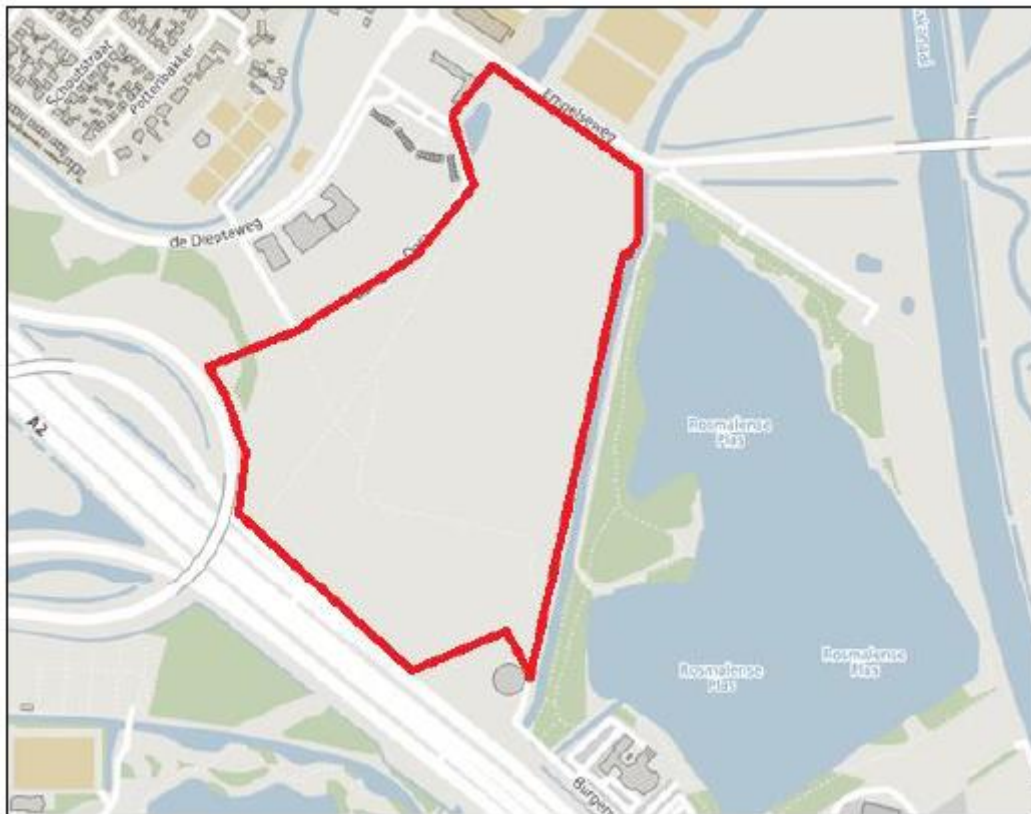
Figuur 1. Locatie Mammoet 2 te 's-Hertogenbosch. De activiteiten vinden plaats binnen het omliggende gebied.