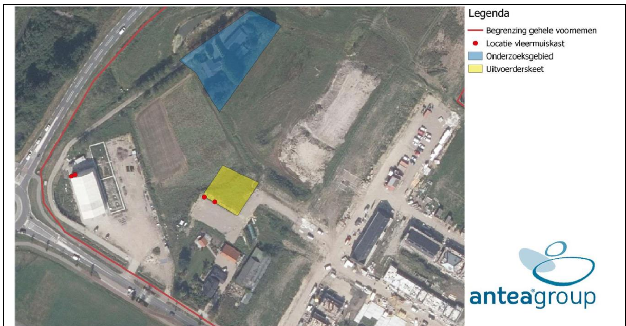
Figuur 2. Locatie van de tijdelijke voorzieningen voor de gewone dwergvleermuis.