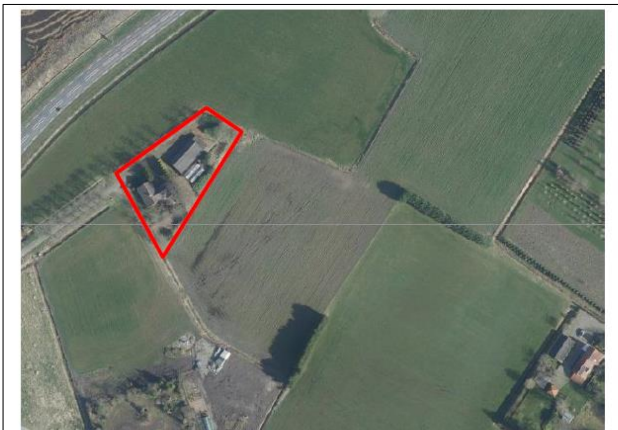
Figuur 1. Locatie Prinsenstraat 60 te Zundert. De activiteiten vinden plaats binnen het omlijnde gebied.