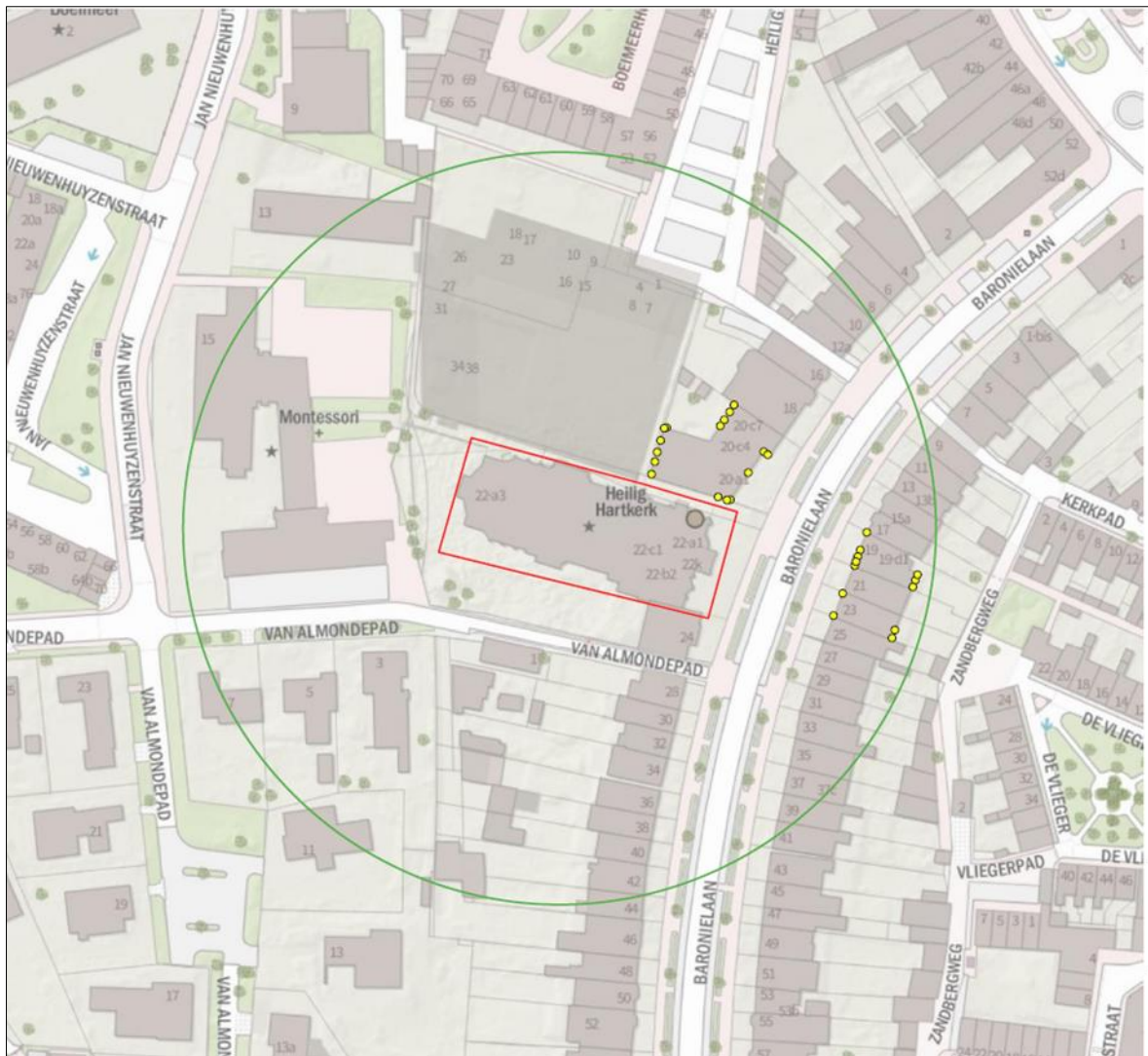
Figuur 2. Locatie van de tijdelijke voorzieningen. Groene cirkel geeft de 100 meter grens aan. Geel de locaties van de tijdelijke kasten.