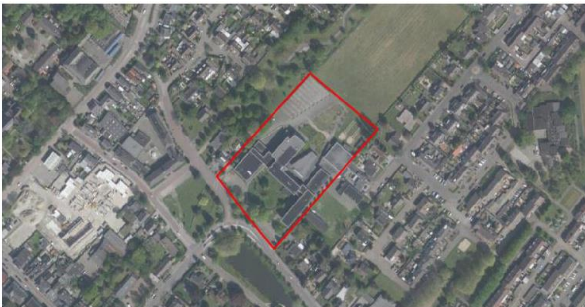
Figuur 1. Locatie Monseigneur Schaepmanlaan 13, 5103 BB te Dongen. De activiteiten vinden plaats binnen het omliggende gebied.