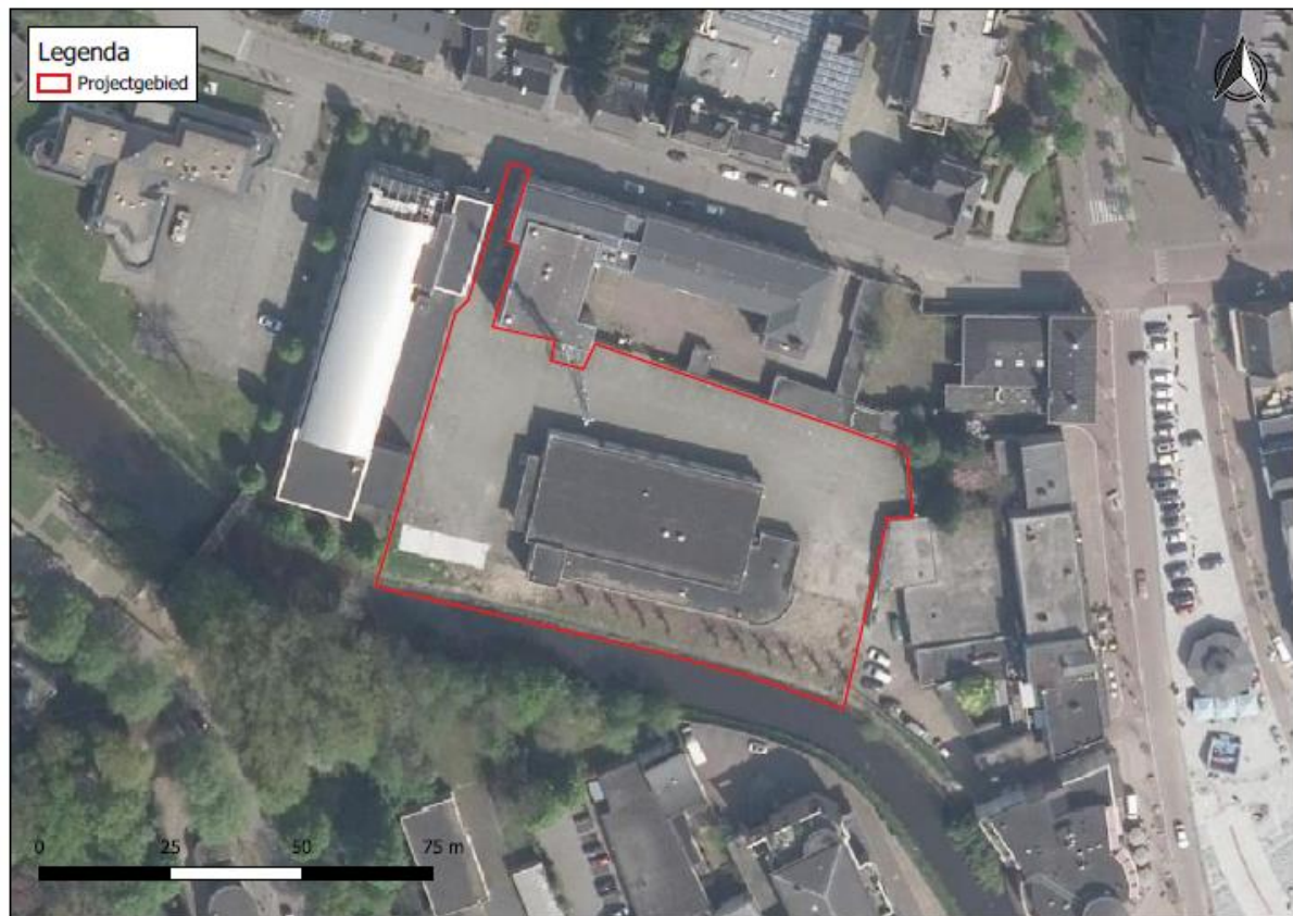
Figuur 1. Locatie Frisselsteinstraat 4 te Veghel. De activiteiten vinden plaats binnen het omliggende gebied.