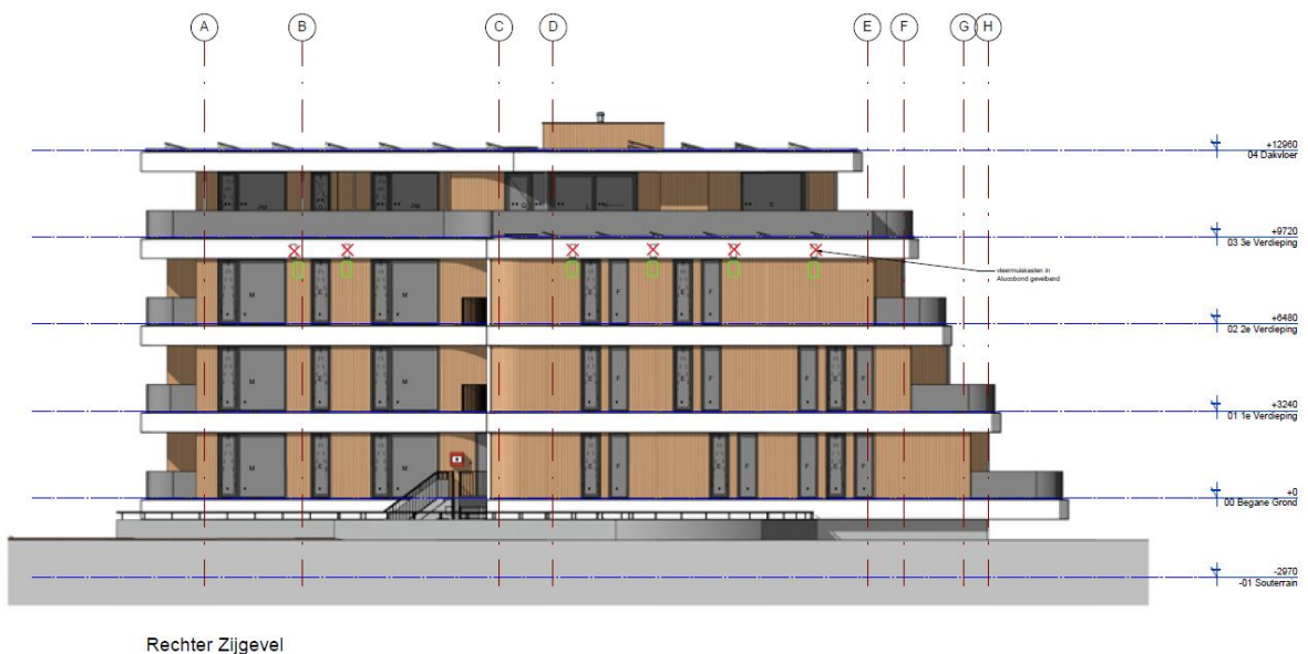
Figuur 3. Locaties van de permanente voorzieningen. De inbouwkasten worden op de tweede verdieping geplaatst en zijn weergegeven met een lichtgroen vierkant.