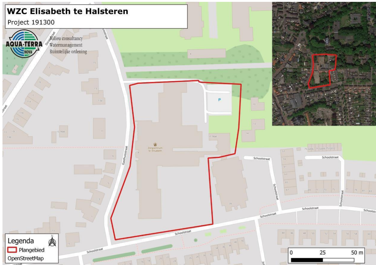
Figuur 1. Locatie woonzorgcentrum St. Elisabeth, Gasthuisstraat 4, 4661 JG te Halsteren. De activiteiten vinden plaats binnen het rood omlijnde gebied.