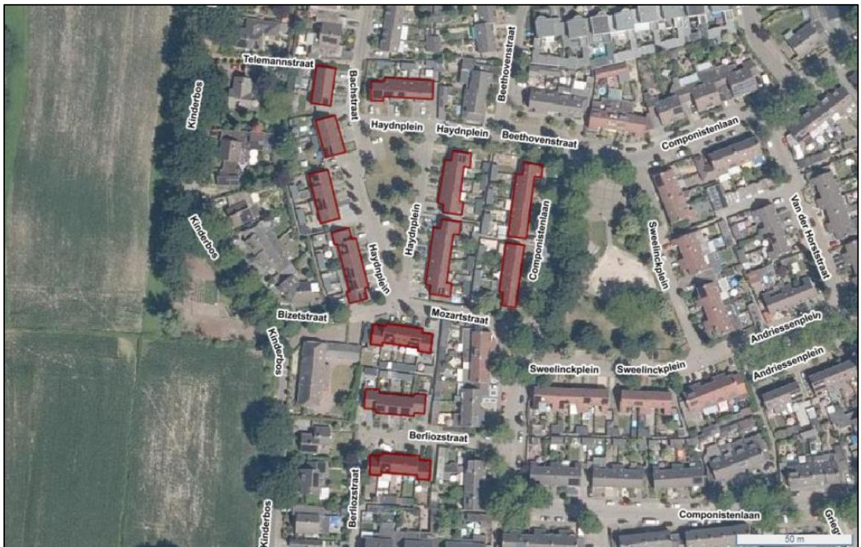
Figuur 1. Locatie Haydnstraat en omgeving te Sint-Oedenrode. Alleen op de Bachstraat 1 en 5, Haydnplein 13, 19, 21, 22 en 25, Mozartstraat 7 en 9 en Berliozstraat 2, 3, 4, 8 en 10 zijn beschermde functies aanwezig en alleen voor deze adressen is de ontheffing geldig. De activiteiten vinden plaats binnen het omliggende gebied.