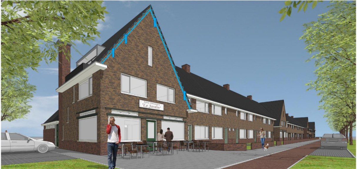
Figuur 7. Impressie plaatsing en verdeling over gevel van maatwerkvoorzieningen voor de gewone dwergvleermuis. Over de gehele voor- en achtergevel wordt de bovenste 200 mm van de spouw niet geïsoleerd. Toegang tot de spouw en onder het dak wordt verwezenlijkt door openingen bij de kantpannen (zie blauwe pijlen ter illustratie).