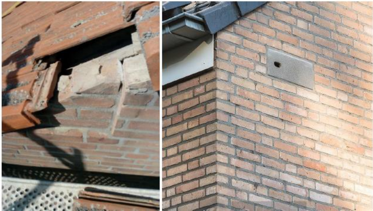
Figuur 5. Impressie maatwerkoplossing voor gierzwaluw (links) en inbouwkast (rechts).