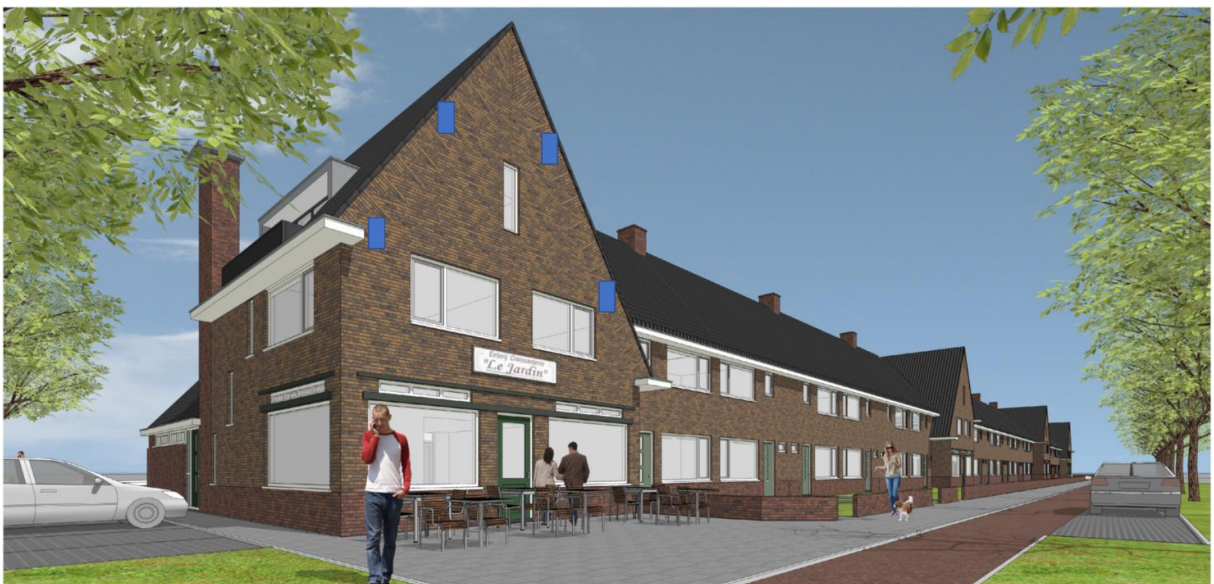
Figuur 8. Impressie verdeling van inbouwkasten voor gewone dwergvleermuis in voorgevel van de toekomstige situatie Graafseweg 142. De inbouwkasten worden op eenzelfde wijze op de achtergevel geplaatst.