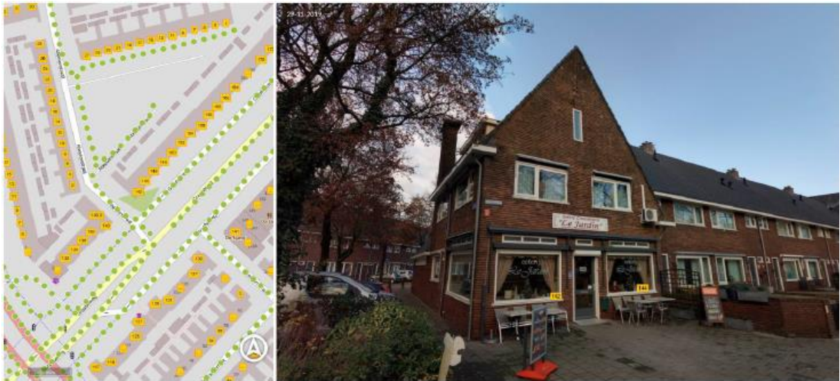
Figuur 1. Locatie Graafseweg 142, 5213 AN te 's-Hertogenbosch. De activiteiten vinden plaats met betrekking tot de hoekwoning, inclusief onderliggende croissanterie, zoals is aangegeven in het rechter plaatje van bovenstaande figuur.