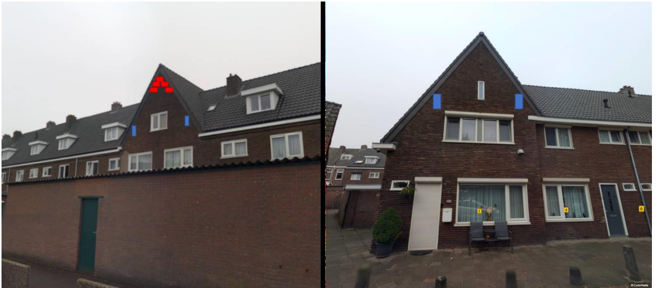
Figuur 3. Impressie van de plaatsing van de tijdelijke nestkasten van gierzwaluw (rood) en tijdelijke vleermuiskasten (blauw) aan de woningen gelegen aan de Graafseweg 156 (links) en Abeelenstraat 2 (rechts). Let op de vleermuiskasten aan de Abeelenstraat 2 zijn komen te vervallen. De kasten zijn opgehangen aan de Abeelenstraat 28.