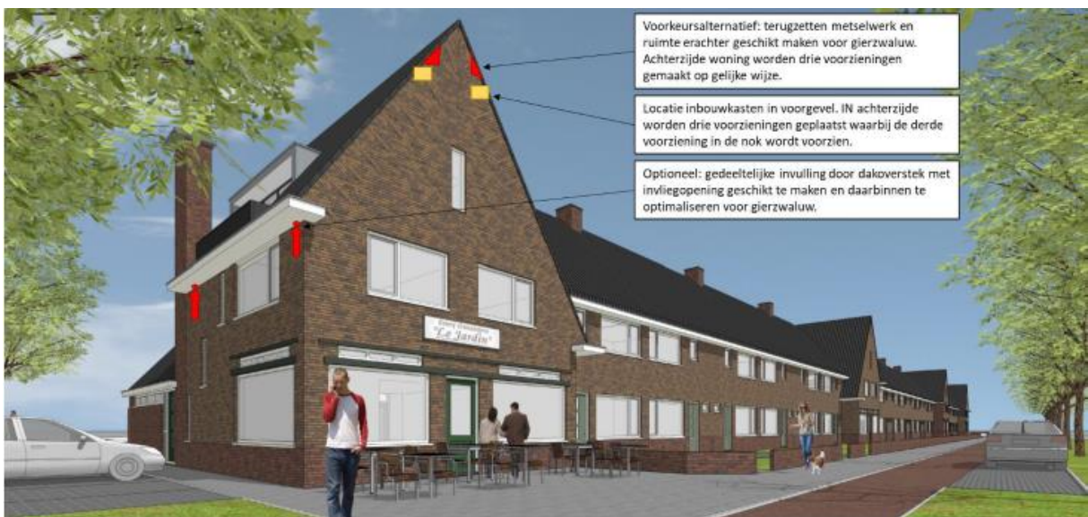
Figuur 4. Impressie plaatsing van de permanente voorzieningen voor de gierzwaluw in de toekomstige situatie.