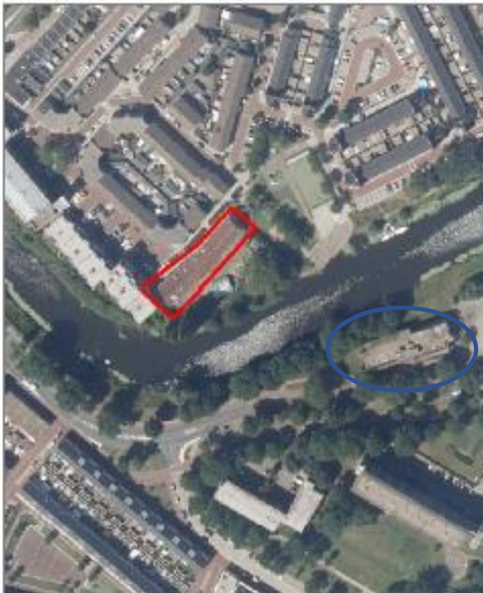
Figuur 2. Locaties van de twintig opgehangen tijdelijke voorzieningen op 26 maart 2020 voor de gewone dwergvleermuis aan het schoolgebouw gelegen aan de Dageraadsweg 1-3 ten opzichte van het te slopen gebouw, in het blauw omcirkeld.