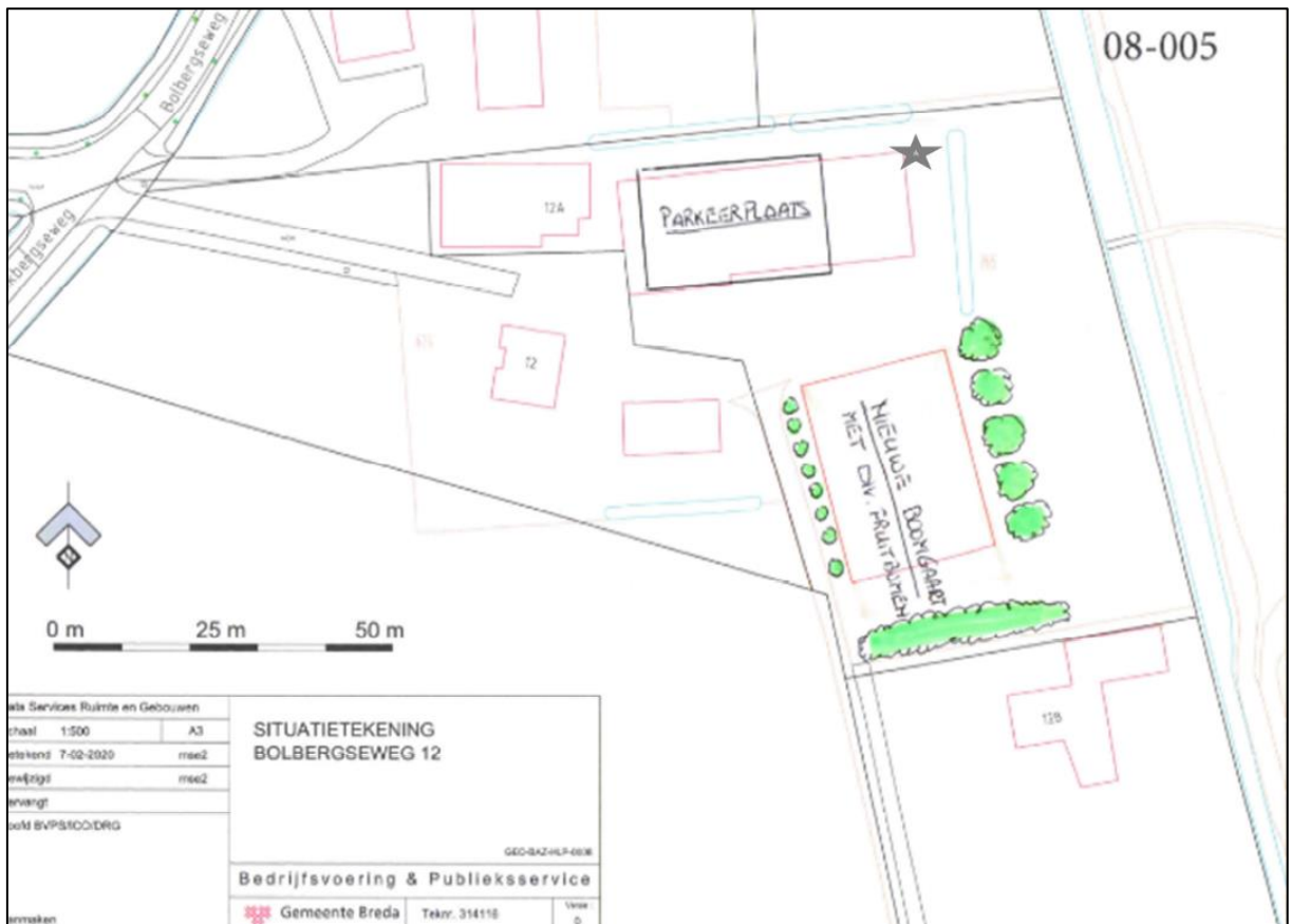
Figuur 3. Situatietekening. De paalkasten worden op de locatie van de grijze ster geplaatst.