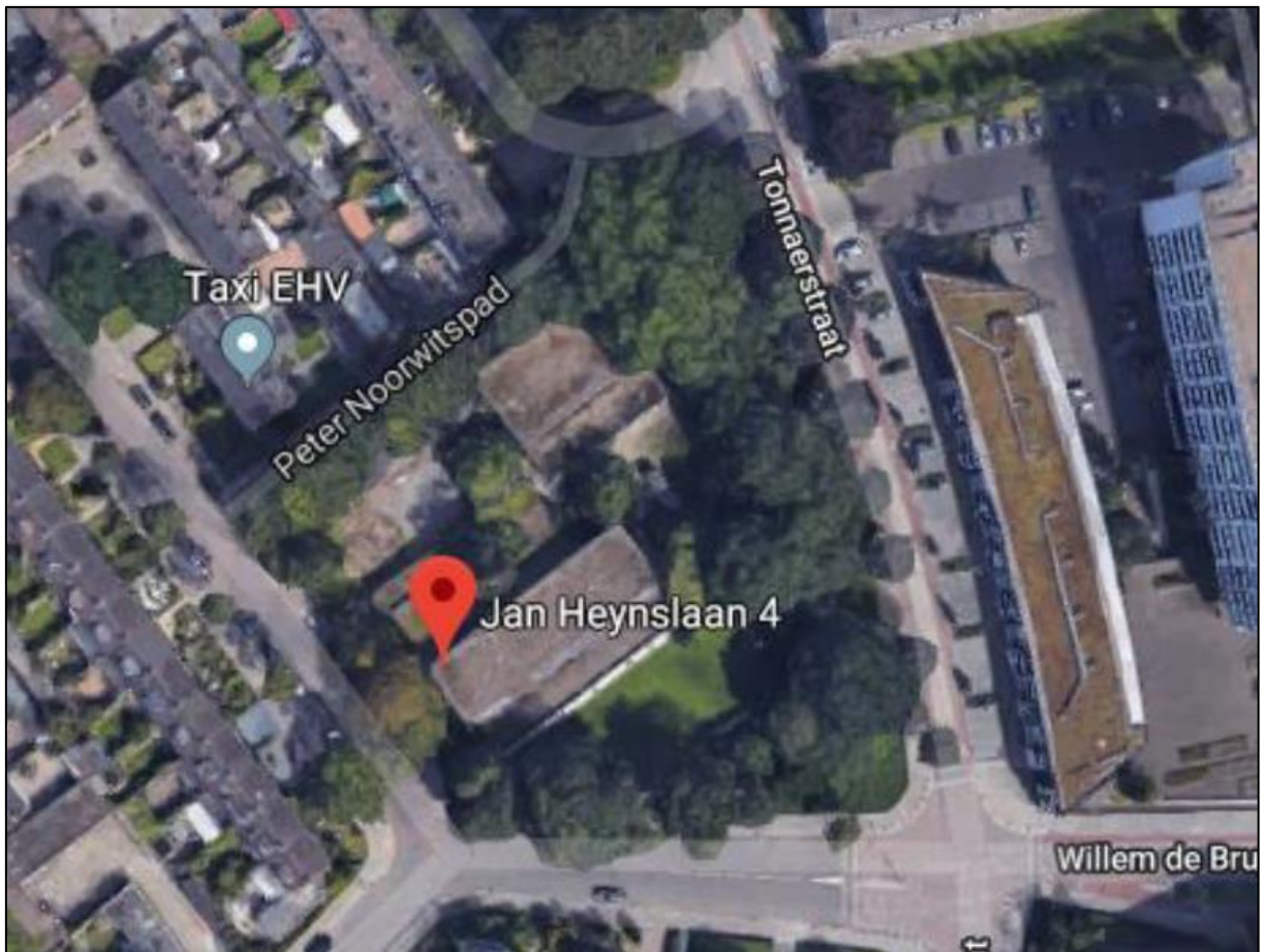
Figuur 1. Locatie Jan Heynslaan 4 te Eindhoven.