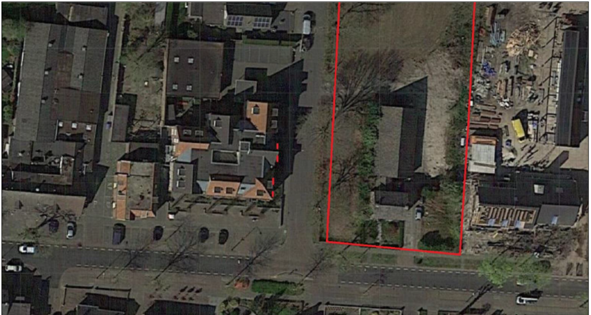
Figuur 2. Originele locatie van de tijdelijke voorzieningen (rode strepen) ten opzichte van het plangebied (rood omlijnd).