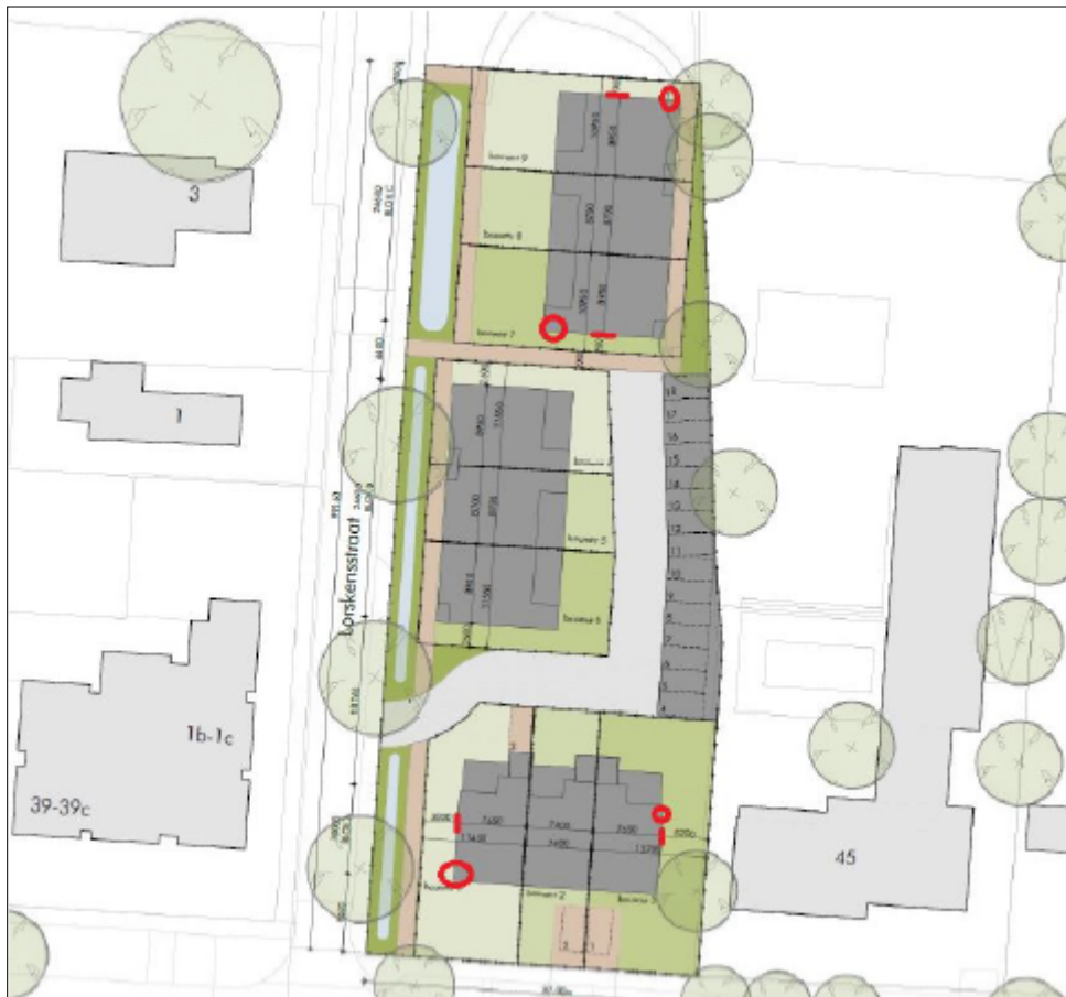
Figuur 4. Locatie van de permanente voorzieningen (invlieg mogelijkheden naar verblijfruimten in de spouw zijn rood omcirkeld).