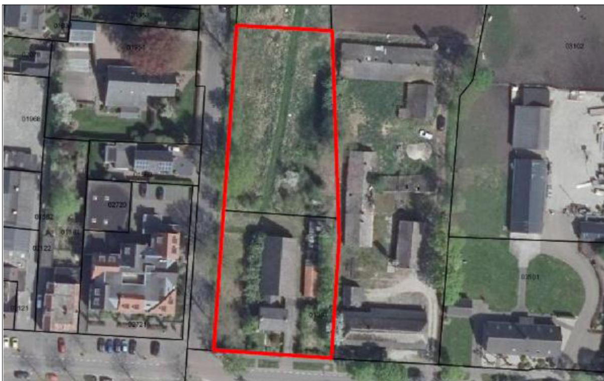
Figuur 1. Locatie Pastoor van Winkelstraat 41 te Schaijk, in de gemeente Landerd. De activiteiten vinden plaats binnen het omliggende gebied.