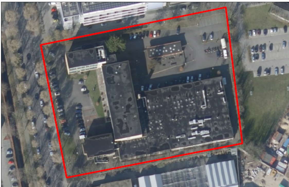
Figuur 1. Locatie Tuinziglaan 12 te Breda. De activiteiten vinden plaats binnen het omliggende gebied.