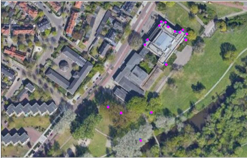
Figuur 3. Locatie van de tijdelijke voorzieningen, weergegeven met roze stippen.