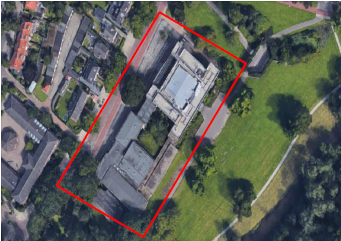
Figuur 1. Locatie Van Maerlantlyceum aan de Jacob van Maerlantlaan 11 te Eindhoven. De activiteiten vinden plaats binnen het omliggende gebied.