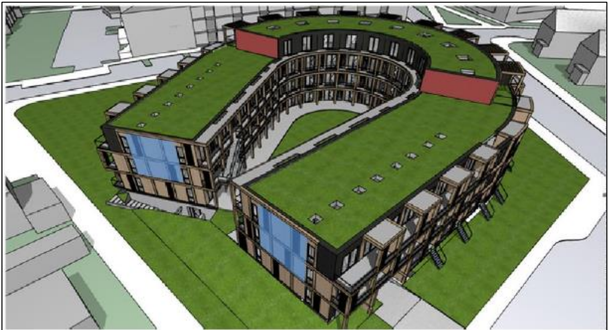
Figuur 5. Plaatsing van de permanente inbouwkasten. Het blauwe vak is de plaatsing van de kleine kasten, het rode vlak is de plaatsing van de kraamkasten.