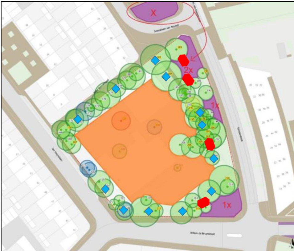
Figuur 2. Locatie van de tijdelijke voorzieningen, blauw zijn de kleine kasten, rood zijn de Schwegler kraamkasten.