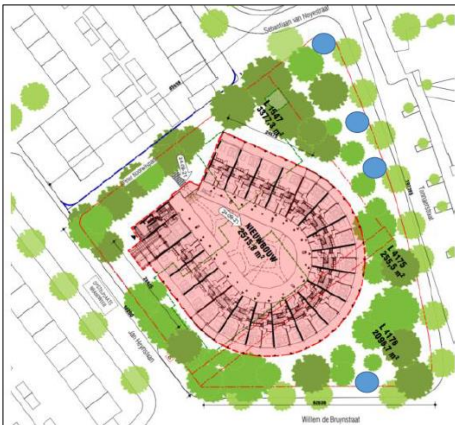
Figuur 3. Locatie van de tijdelijke voorzieningen (kraamkasten van faunaprojecten, zie figuur 4).