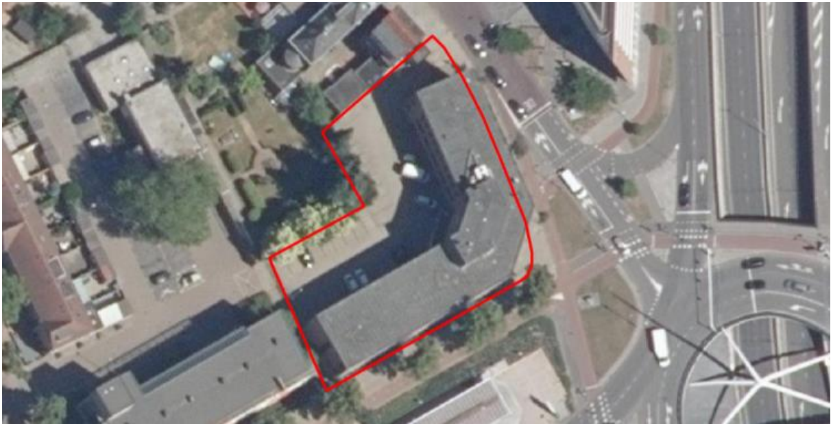
Figuur 1. Locatie Noord Brabantlaan 2 te Eindhoven. De activiteiten vinden plaats binnen het omliggende gebied.