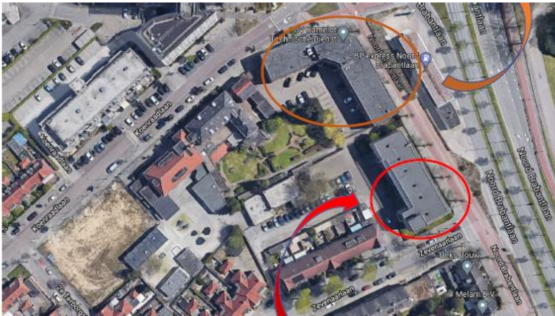
Figuur 2. Locatie van de tijdelijke voorzieningen. De tijdelijke voorzieningen zijn geplaatst binnen het rood omcirkelde gebied. De huidige verblijfplaatsen bevinden zich binnen de oranje cirkel.