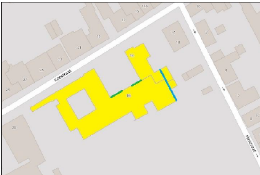
Figuur 3. Locatie waar de permanente nestplaatsen worden gerealiseerd. Met blauw is de locatie van de huismus aangegeven, met groen de locatie van de gierzwaluw.