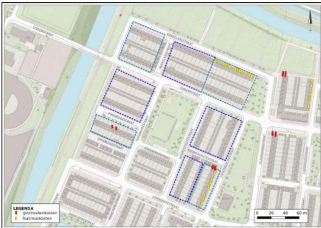
Figuur 4. Locatie van de tijdelijke voorzieningen voor de huismus en gierzwaluw. De gele stippen geven de huismuskasten aan, de rode stippen geven de gierzwaluwkasten aan.