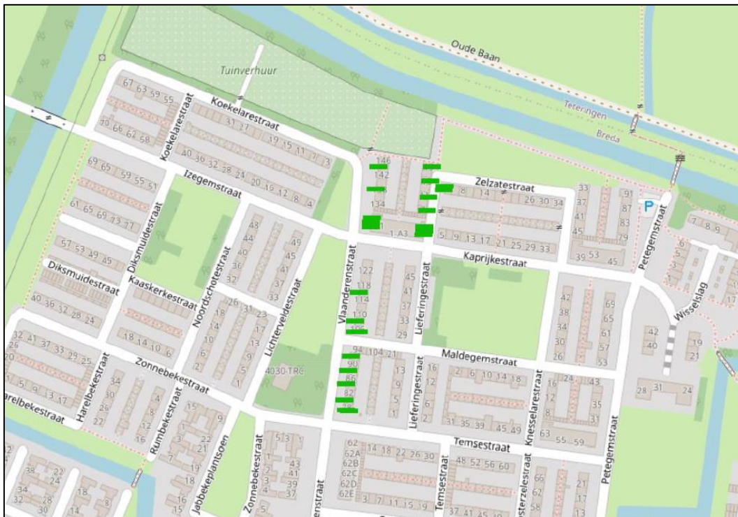
Figuur 3. Locatie van de tijdelijke voorzieningen voor de gewone dwergvleermuis.