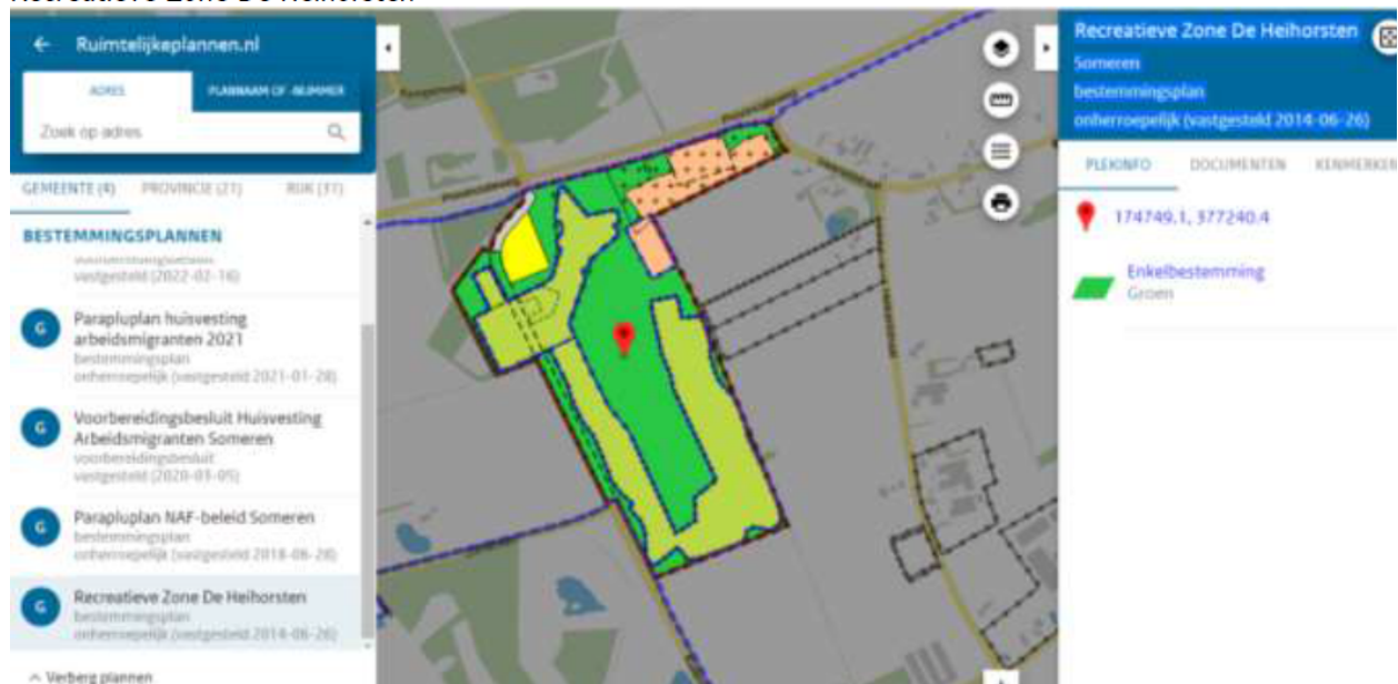
Uitsnede bestemmingsplan Recreative Zone De Heihorsten, Someren, bestemmingsplan (vastgesteld 2014-06-26) Bestemming Groen

Het deel met de bestemming Groen op het perceel voor Strabrechtse Vennen valt in het bestemmingsplan Recreative Zone De Heihorsten