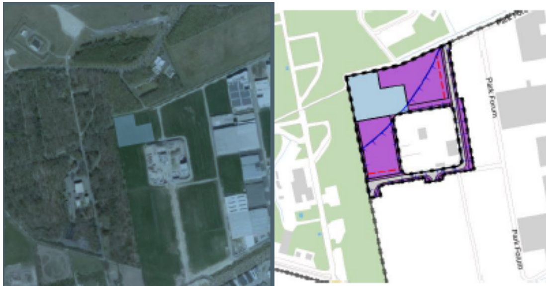
Abbeelding 1: Luchtfoto huidige situatie (links) en geplande situatie (rechts, waterbassin is blauw gearceerd).

De hieronder genoemde belangen zijn bij de ontgroning betrokken: