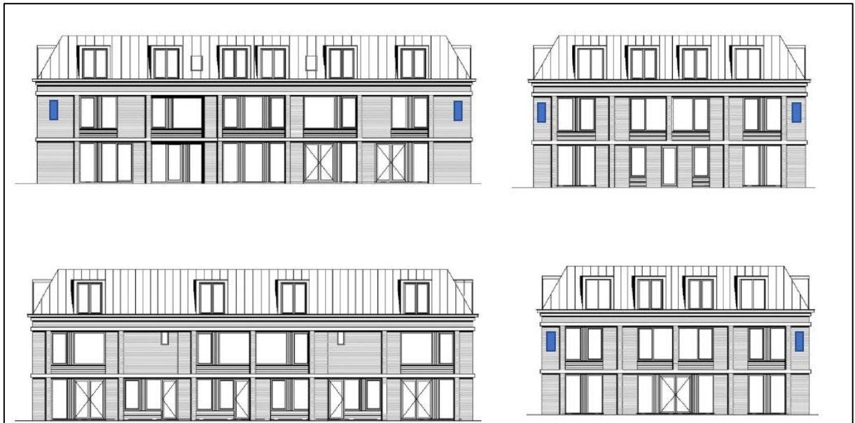
Figuur 3. Locatie van de permanente voorzieningen (Linksboven: zuidwestgevel gebouw 1 (noordwestgevel gebouw 2), rechtsboven: noordwestgevel gebouw 1 (noordoostgevel gebouw 2), linksonder: noord oostgevel gebouw 1 (zuidoostgevel gebouw 2), rechtsonder: zuidoostgevel gebouw 1 (zuidwestgevel gebouw 2).