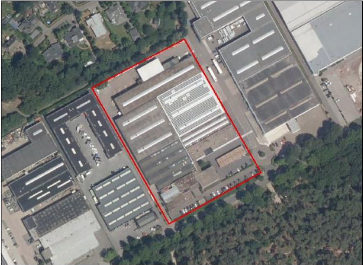
Figuur 1. Locatie John F. Kennedylaan 25-27 op het industrieterrein De Schaapsloop te Valkenswaard. De activiteiten vinden plaats binnen het omliggende gebied. Het gedeelte met de zwarte/grijze daken wordt gesloopt. Het deel met het witte dak met de zonnepanelen wordt gerenoveerd.