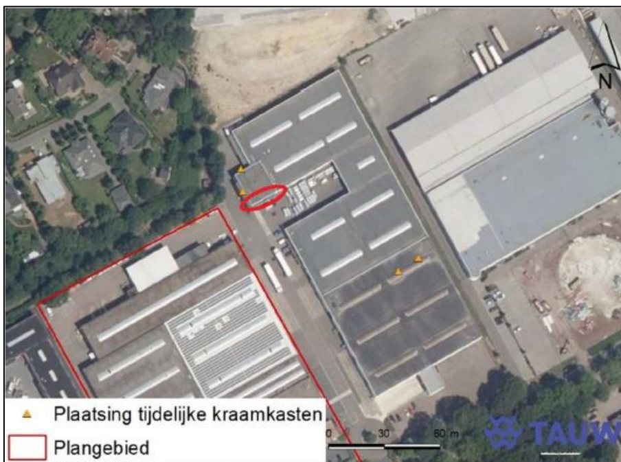
Figuur 3. Locatie van de tijdelijke kraamkasten. De rode cirkel geeft de locatie aan waar in juni 2022 nog een extra kraamkast is geplaatst.