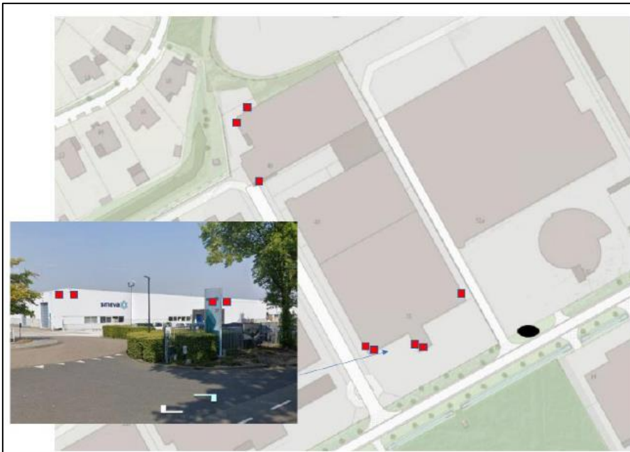
Figuur 2. Locatie van de tijdelijke zomerverblijfplaatsen.