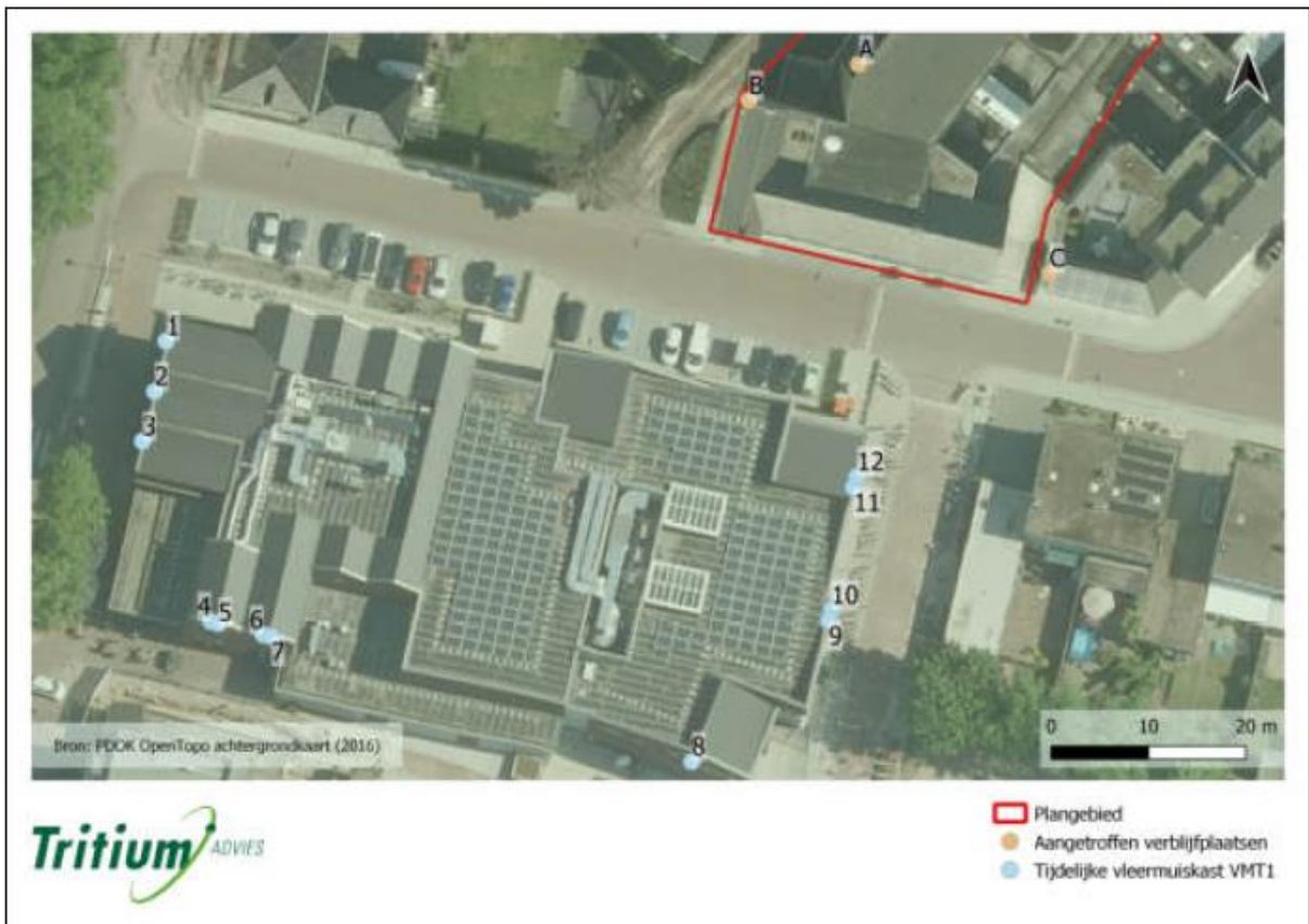
Figuur 2. Locatie van de tijdelijke voorzieningen.