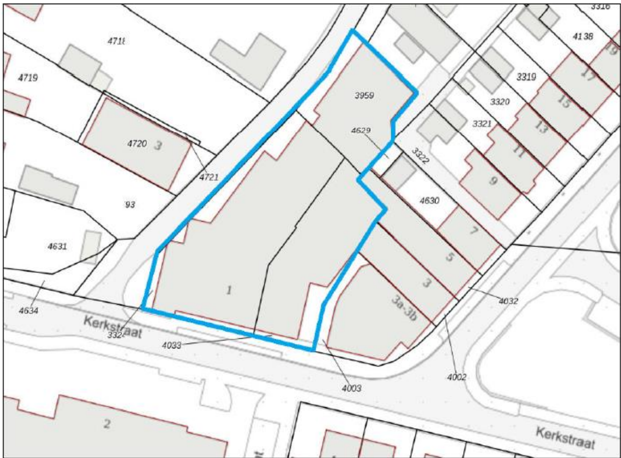
Figuur 1. Locatie Kerkstraat 1 Leende. De activiteiten vinden plaats binnen het omliggende gebied.