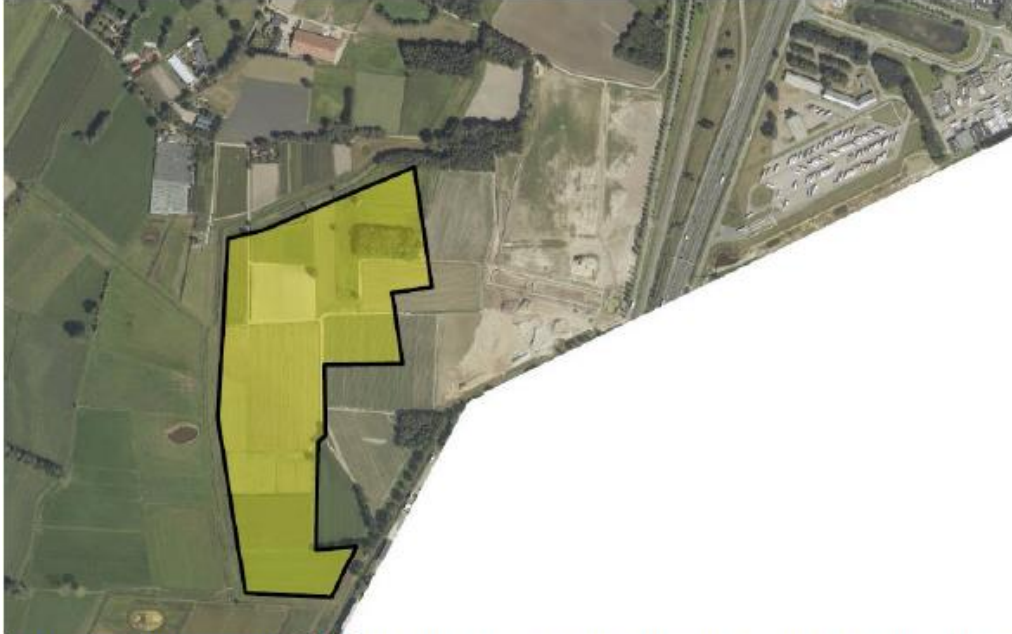
Uitsnede luchtfoto anno 2019 met aanvullend in geel met zwarte omlijning de plangrens voor de 2e fase

Het bedrijventerrein ligt tegen de grens met België, ten westen van de HSL en A16. Het betreffen 7 kadastrale percelen in het plangebied van fase 2. De 2 e fase is gelegen ten westen van de 1 e fase.