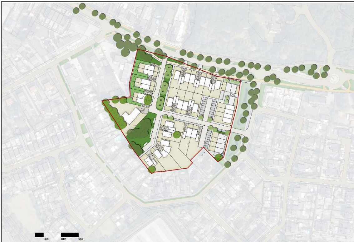
Figuur 2. Toekomstige situatie