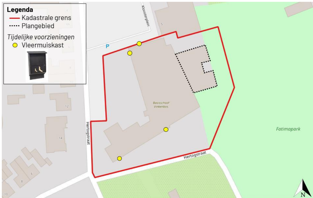
Figuur 3. Locatie van de tijdelijke voorzieningen.