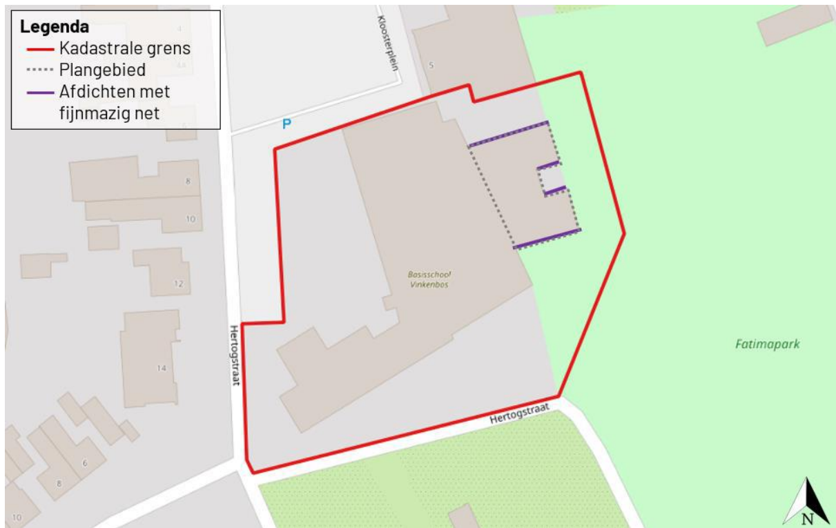
Figuur 2. Voorafgaand aan de werkzaamheden dienen de gevels binnen het plangebied welke bestaan uit houten panelen afgedicht te worden met fijnmazig net. Deze gevels zijn met paars aangegeven.