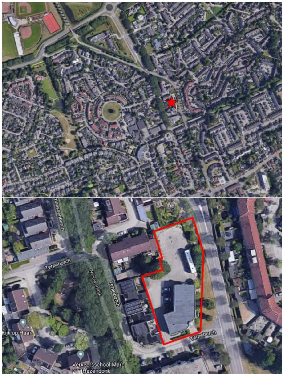
Figuur 1. Locatie Terpeborch 1 te Rosmalen. De activiteiten vinden plaats binnen het omliggende gebied.