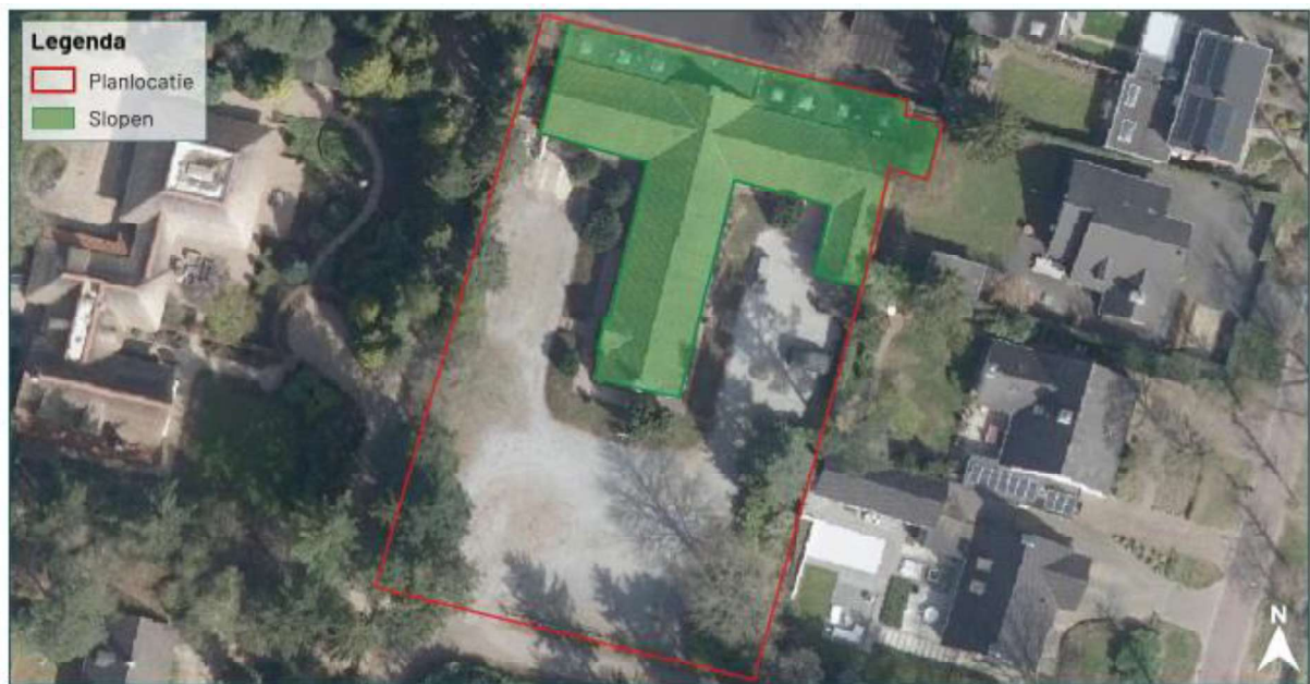
Figuur 1. Locatie Dennelaan 1, 5583 AC, Waalre. De activiteiten vinden plaats binnen het omliggende gebied.