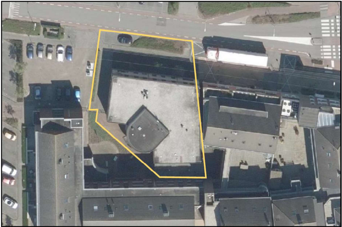
Figuur 1. Locatie recreatiecentrum De Wig aan de Iman van den Boschstraat 2a te Best. De activiteiten vinden plaats binnen het omliggende gebied.