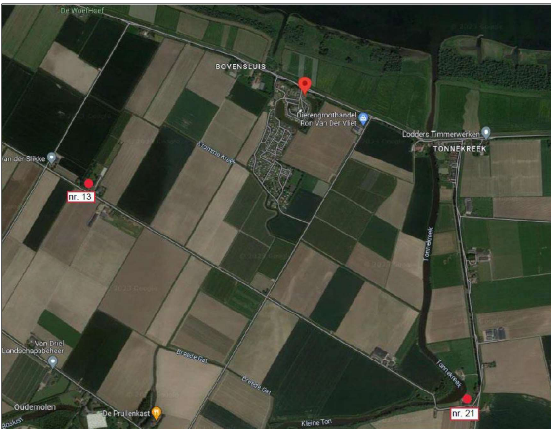
Figuur 3. Locatie van de bestaande uilenkasten in de omgeving (rode stippen met nummer 13 en 21) ten opzichte van de projectlocatie (rode pin).