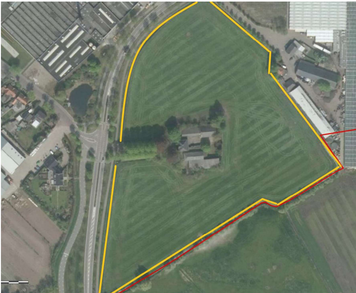
Figuur 1. Locatie Malthezer hoeve aan de Helmondseweg 41 te Aarle-Rixtel. De activiteiten vinden plaats binnen het geel omlijnde gebied.