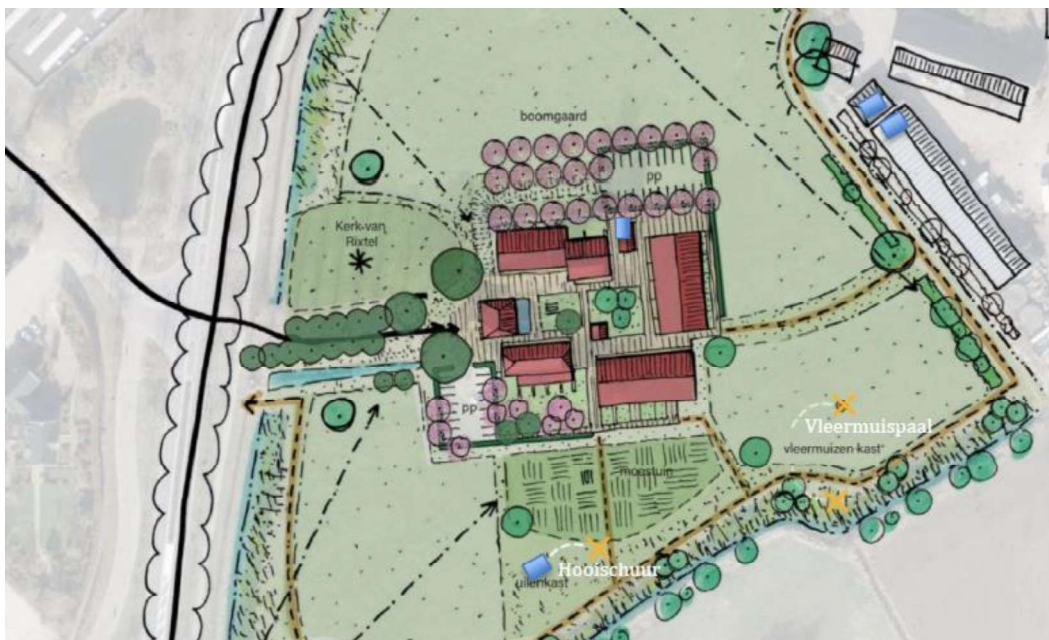
Figuur 3. Locatie van toekomstige permanente voorzieningen voor de kerkuil (blauwe vakken). De twee locaties ten noordoosten buiten het plangebied zijn reeds aanwezig.