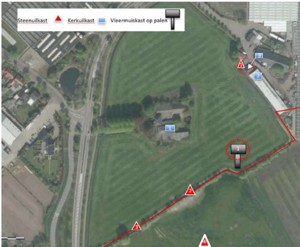
Figuur 2. Locatie van de tijdelijke voorzieningen voor de kerkuil (blauw). Locatie 1 bevindt zich in de te slopen bebouwing en zal daarom voorafgaand aan de sloop worden verwijderd. Locatie 2 en 3 zullen ook in de permanente situatie blijven bestaan.