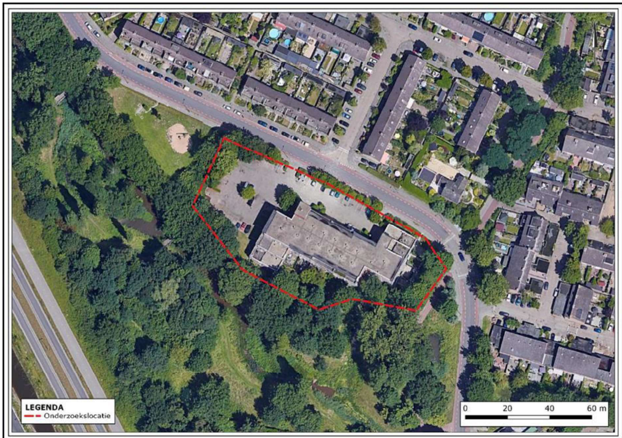
Figuur 1. Locatie wooncomplex 2000 aan de Ambachtenlaan 80-208. De activiteiten vinden plaats binnen het rood omlijnende gebied.