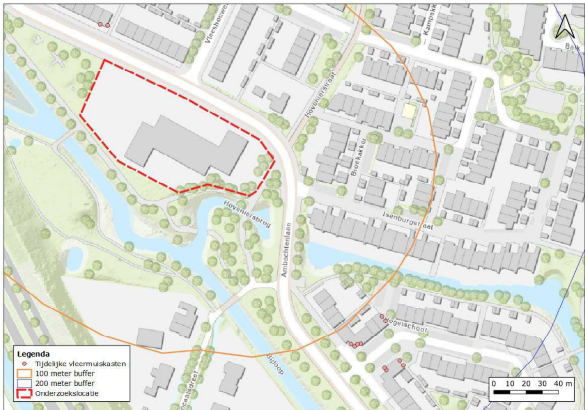
Figuur 2. Locatie van de tijdelijke voorzieningen.