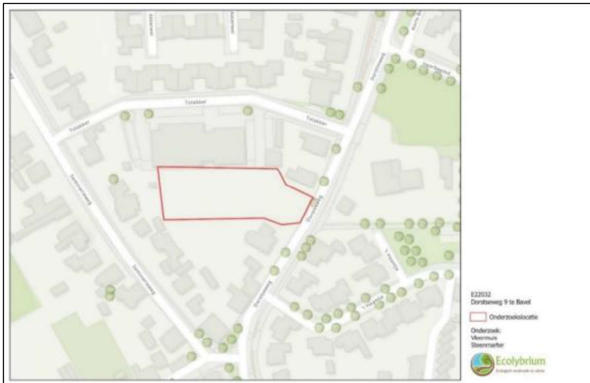
Figuur 1. Locatie Dorstseweg 9 te Bavel. De activiteiten vinden plaats binnen het omliggende gebied.