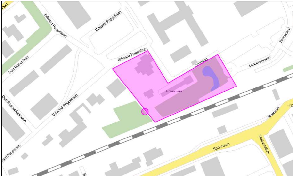
Figuur 1. Locatie Edward Poppelaan 14 te Etten-Leur. De activiteiten vinden plaats binnen het omliggende gebied. Het cirkeltje toont de locatie van de te kappen boom met het roekennest.