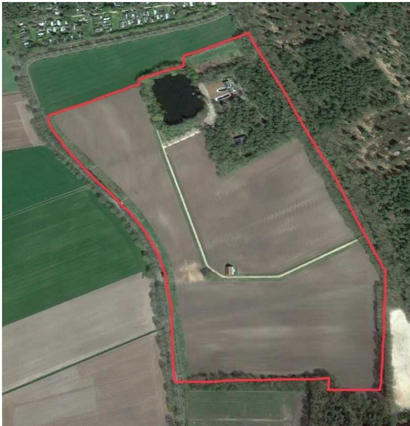
Figuur 1 Projectgebied (begrenst met rode lijn)

Het plangebied ligt aan de Kerkweg in Nispen. De initiatiefnemer is van plan om in het 15 hectare grote plangebied van het landgoed “Gienderwijte” natuur te ontwikkelen in combinatie met de aanleg van waterinfiltratiebekkens, een paddenpoel en het vergroten van de zoetwaterplas. Een en ander in afstemming met het waterschap Brabantse Delta. Daarvoor zal ca 11,5 ha landbouwgrond omgezet worden naar nieuwe natuur en toegevoegd worden aan het NNB (Natuur Netwerk Brabant). Het gebied was vroeger onderdeel van een heidegebied dat kort na 1945 is ontgonnen en omgezet naar landbouwgrond. Daarbij is destijds een 2 meter dik zandpakket verwijderd voordat de bouwvoor werd aangebracht.