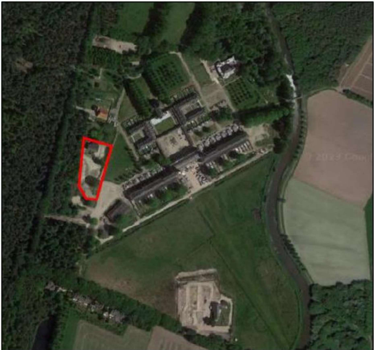
Figuur 1. Locatie van het plangebied aan de Galderseweg 87 te Breda. De activiteiten vinden plaats binnen het omliggende gebied.