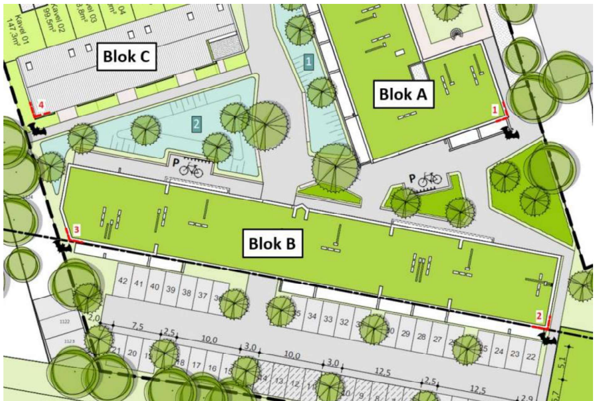
Figuur 3. : Locaties van de vier permanente verblijfplaatsen in de nieuwbouw weergegeven met rode stippellijnen.