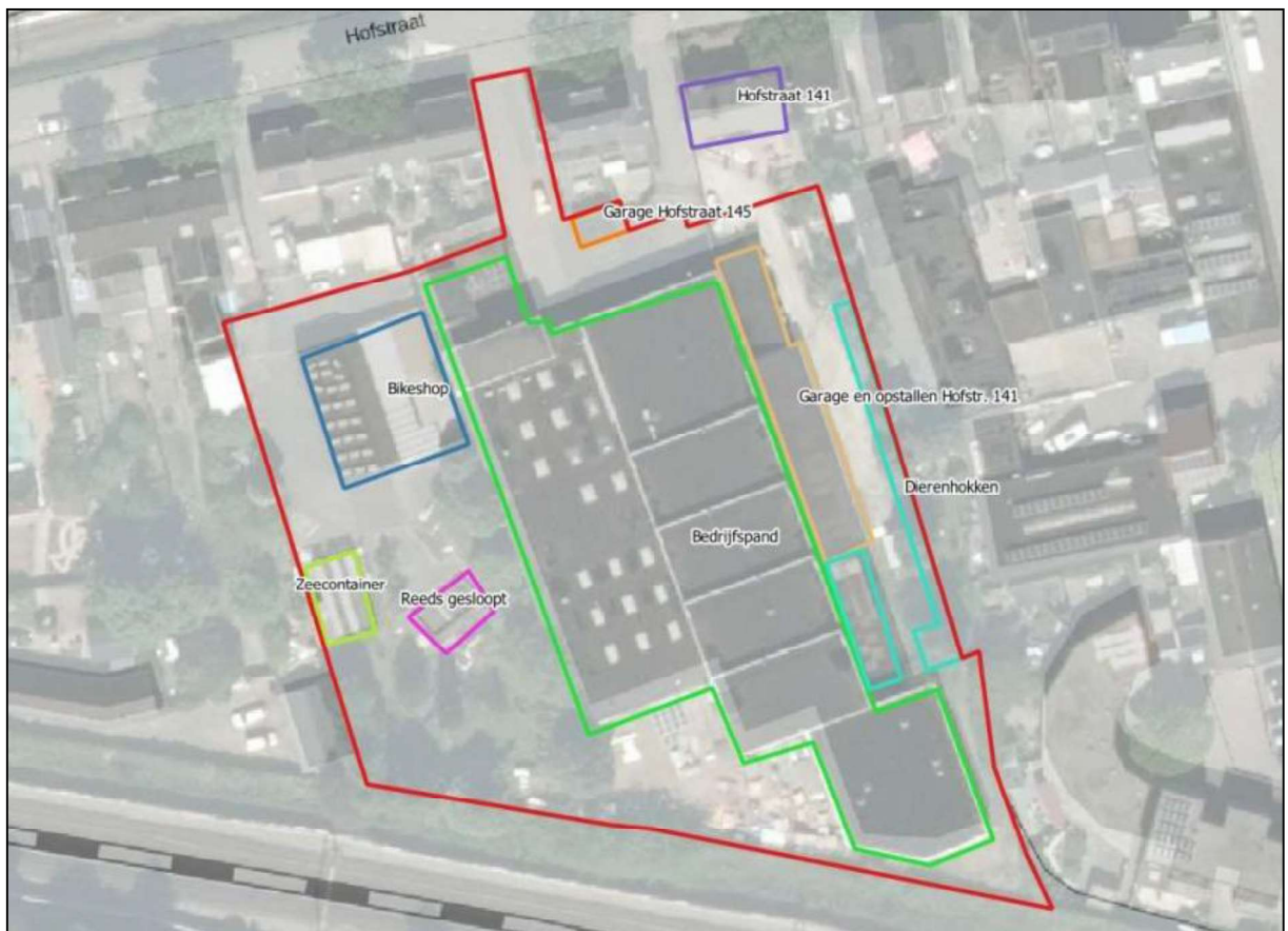
Figuur 1. Locatie Hofstraat 145a, 5641 TD te Eindhoven. De activiteiten vinden plaats binnen het rood omliggende gebied.