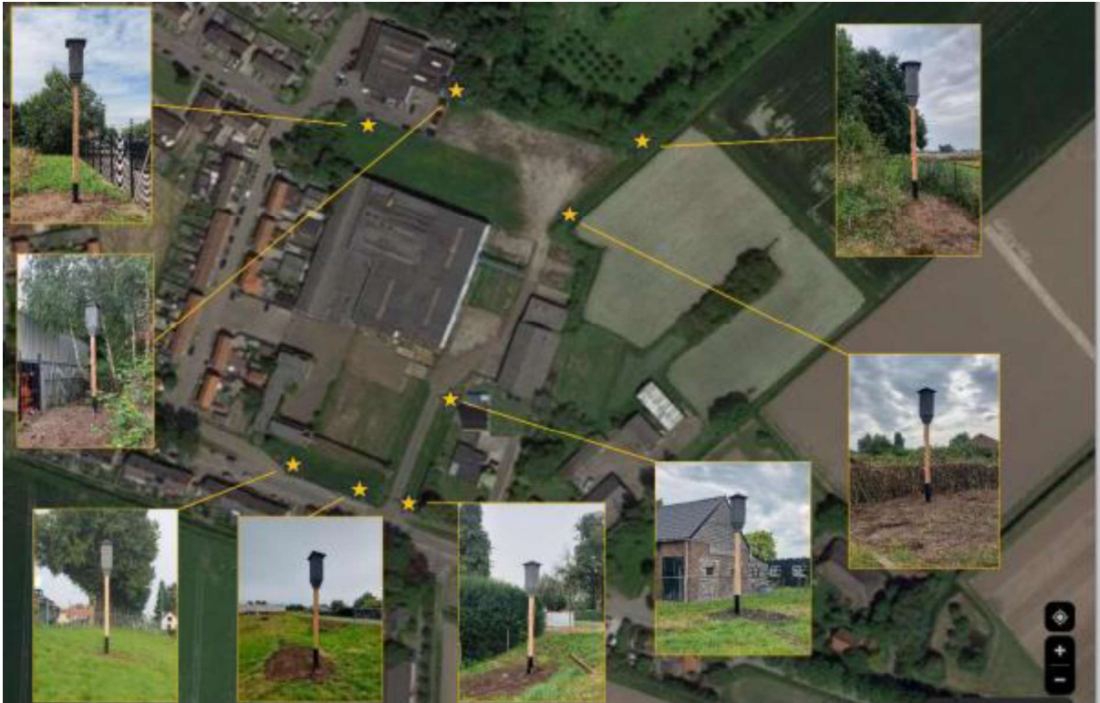
Figuur 4. Locatie van de tijdelijke voorzieningen (VK SK 04) voor de gewone dwergvleermuis.