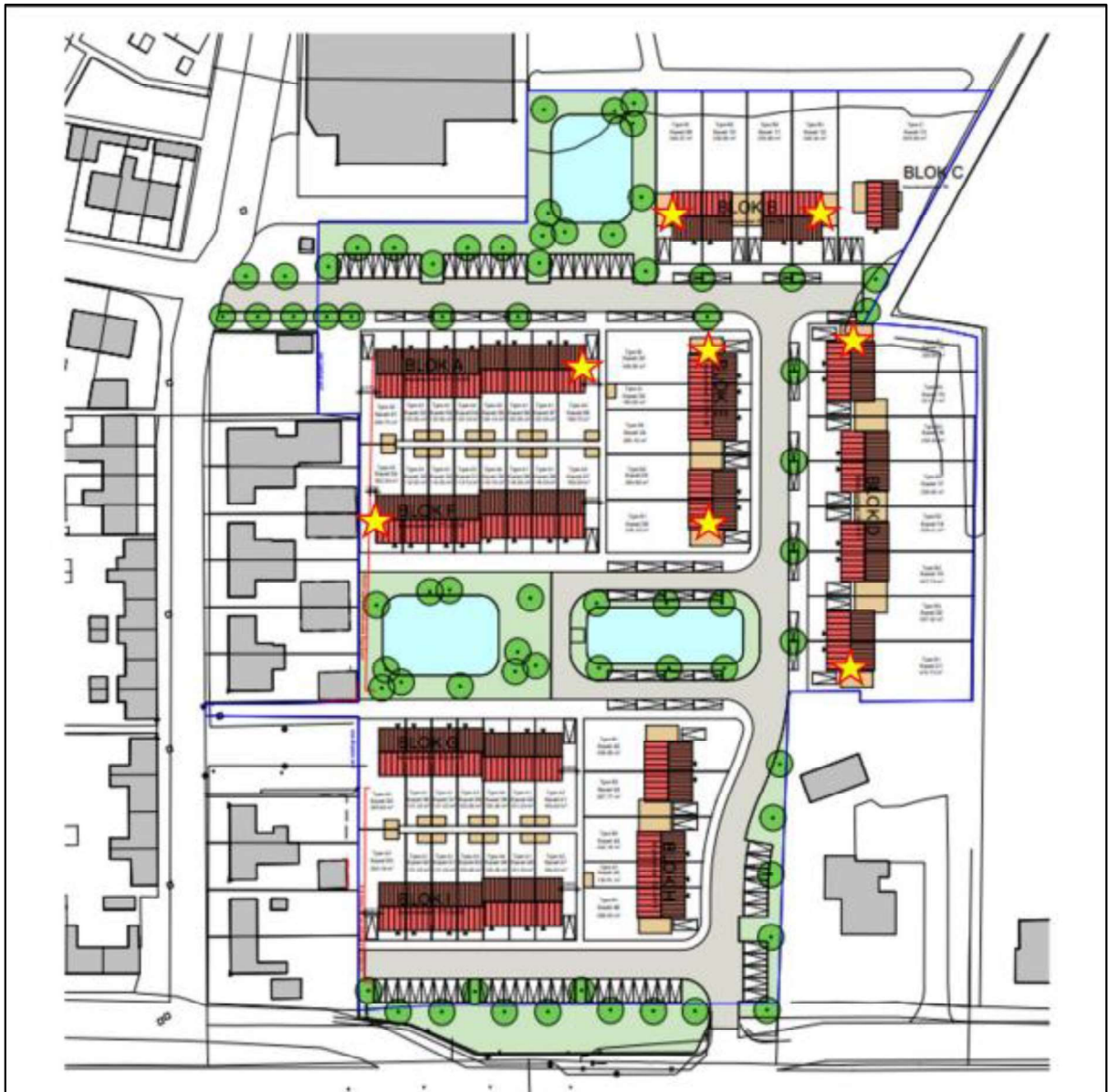
Figuur 5. De 8 locaties waar de IB VL 10 verblijfplaatsen voor de gewone dwergvleermuis worden gerealiseerd.