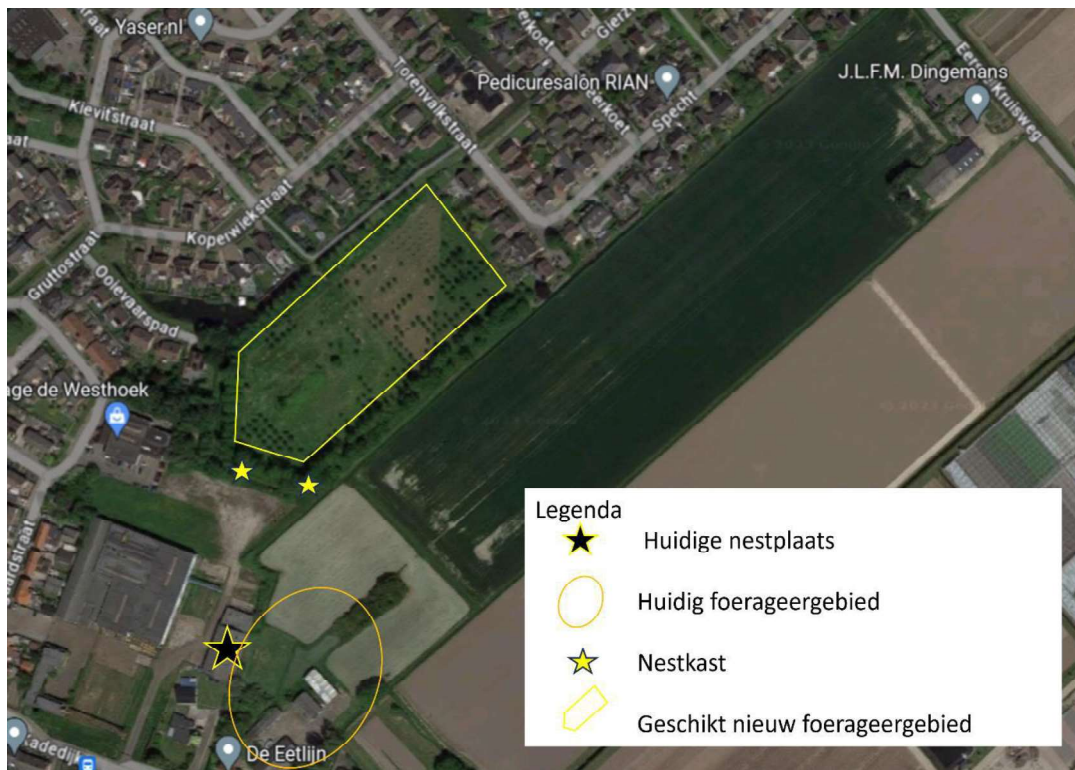
Figuur 2. Locatie van de voorzieningen voor de steenuil.