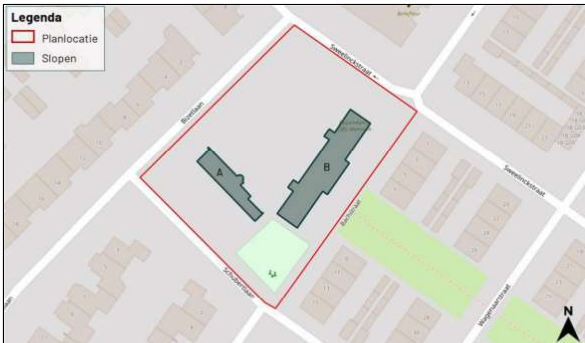
Figuur 1. Locatie Schubertlaan 1 (gebouw A) en Sweelinckstraat 10 (gebouw B) te Oosterhout. De activiteiten vinden plaats binnen het rood omlijnde gebied.