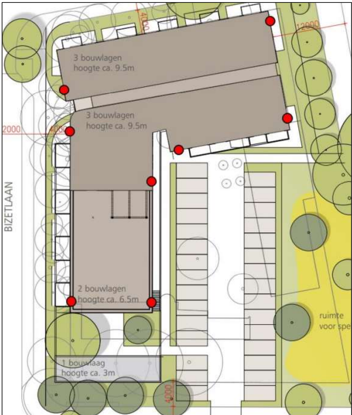
Figuur 3. Locaties van de permanente voorzieningen. De rode stippen betreffen entreestenen die toegang geven tot de spouwmuur.