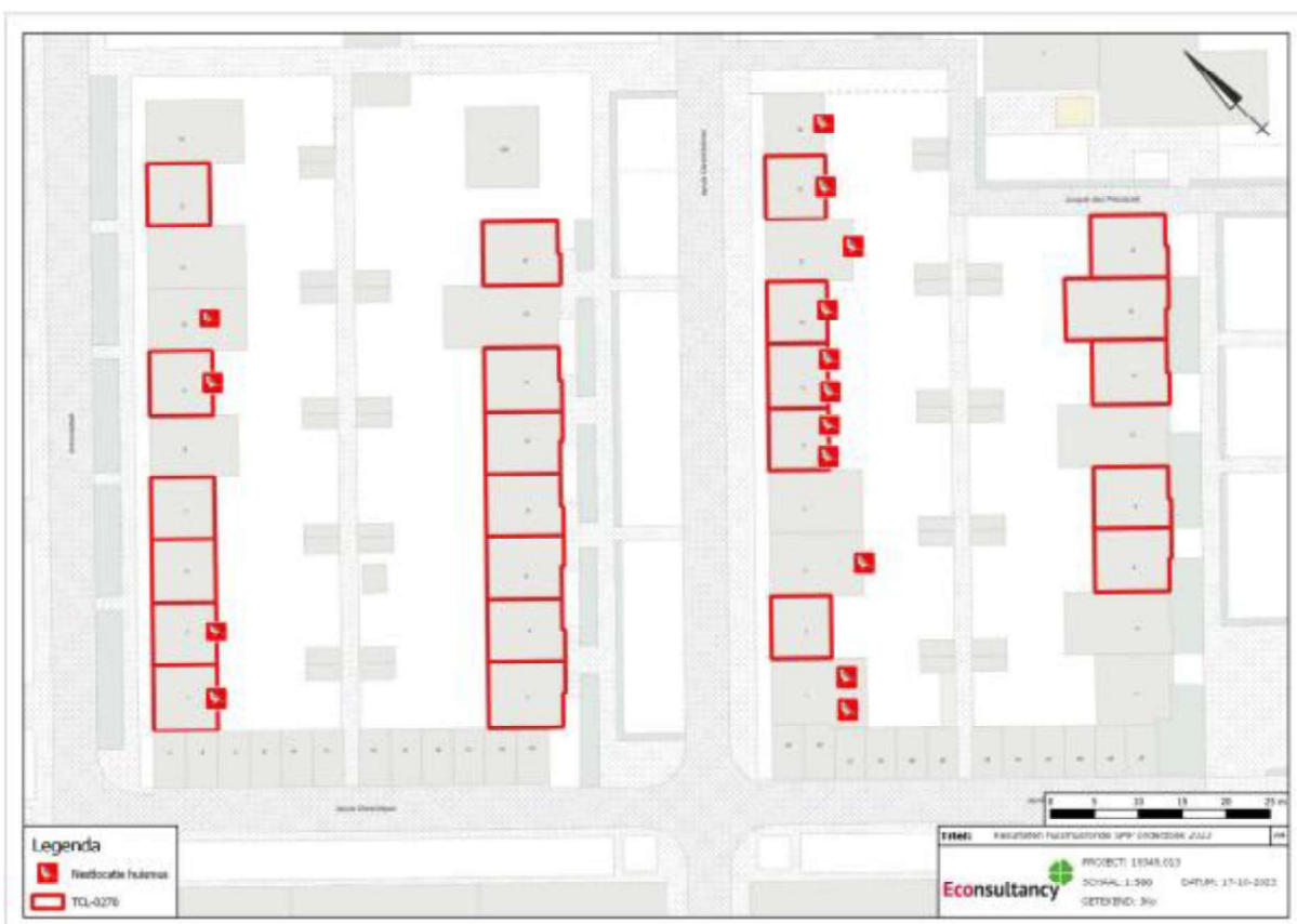
Figuur 2. Overzichtskaart verblijfplaatsen