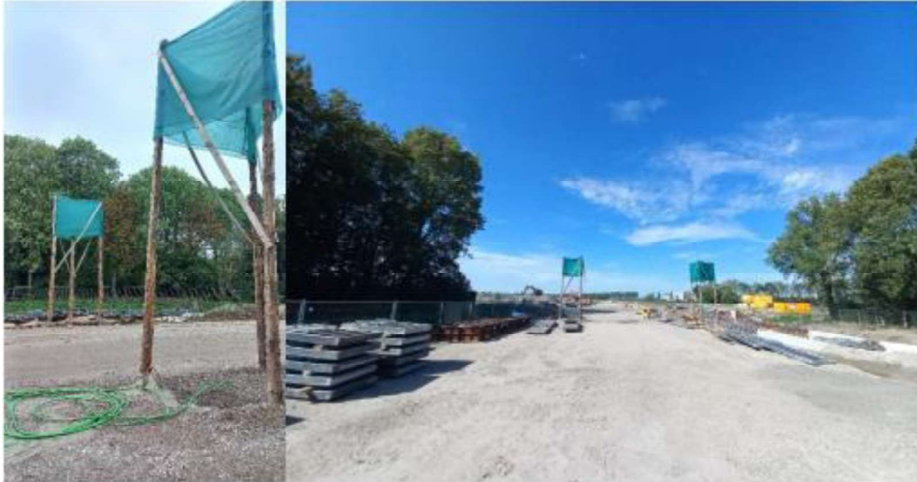
Figuur 3. Hop-over die geplaatst wordt bij de vliegroute van vleermuizen aan de noordkant van de N260A.

een nieuwe hop-over aanwezig is. Onder de hop-over, aan de westzijde van de N260A zullen de Amerikaanse eiken worden gekapt.