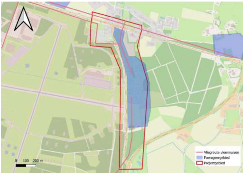
Figuur 2. Locatie N282 en de N260A. De rode lijn geeft de huidige vliegroute van vleermuizen aan. Aan de noordkant van de N260A gaat de vliegroute over de weg heen, richting Hulten. Hier zal een hop-over komen voor de vleermuizen tijdens de werkzaamheden en daarna tot er door nieuwe bomen