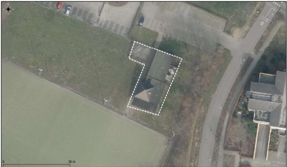
Figuur 1. Aanduiding van het te slopen clubgebouw van Hockeyclub Grave. De activiteiten vinden plaats binnen het omliggende gebied.