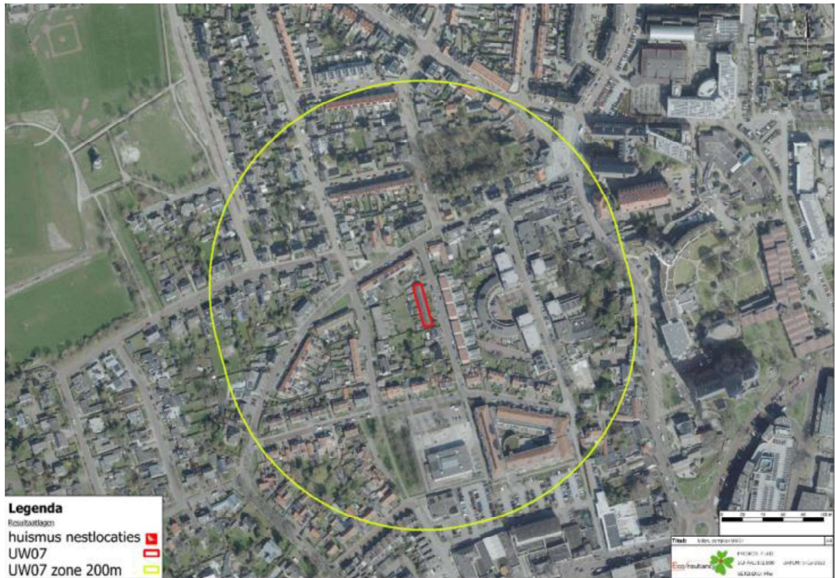
Figuur 2. Straal waarbinnen de tijdelijke maatregelen worden gerealiseerd.