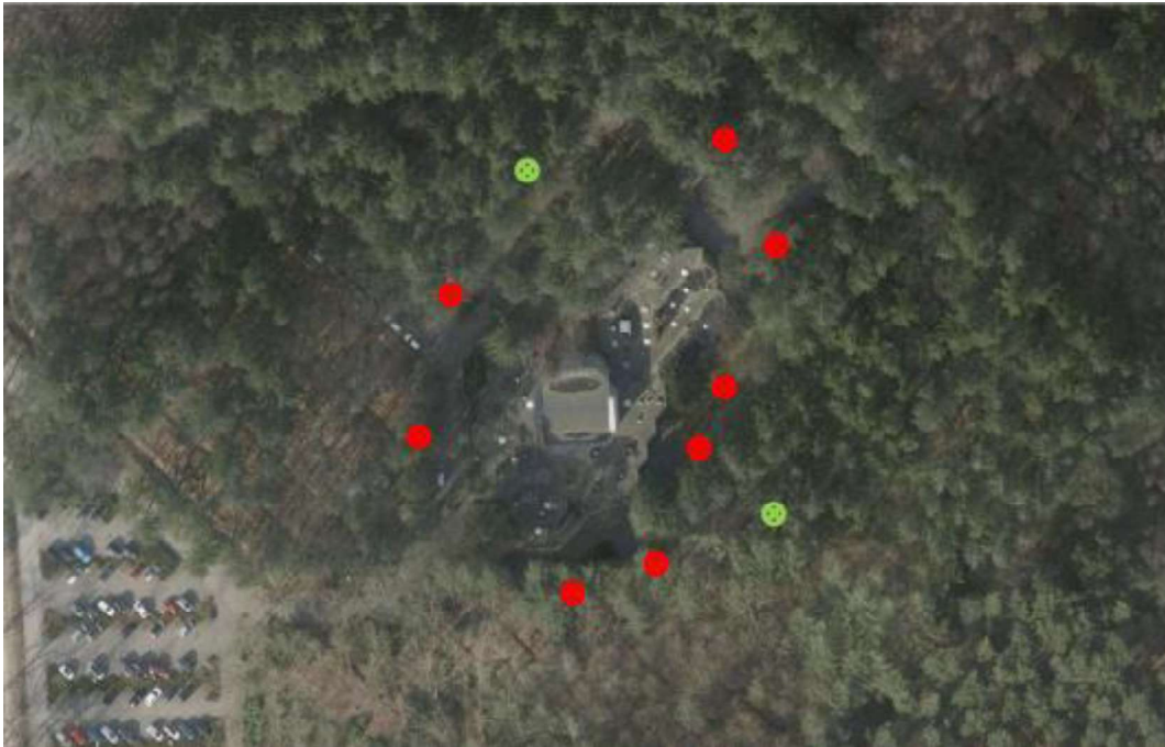
Figuur 2. Locatie van de tijdelijke voorzieningen. Rood= VKSK 04 vleermuispaalkast, Groen= VK SK 03 platte vleermuiskast, geplaatst in opstelling rug-tegen-rug palen