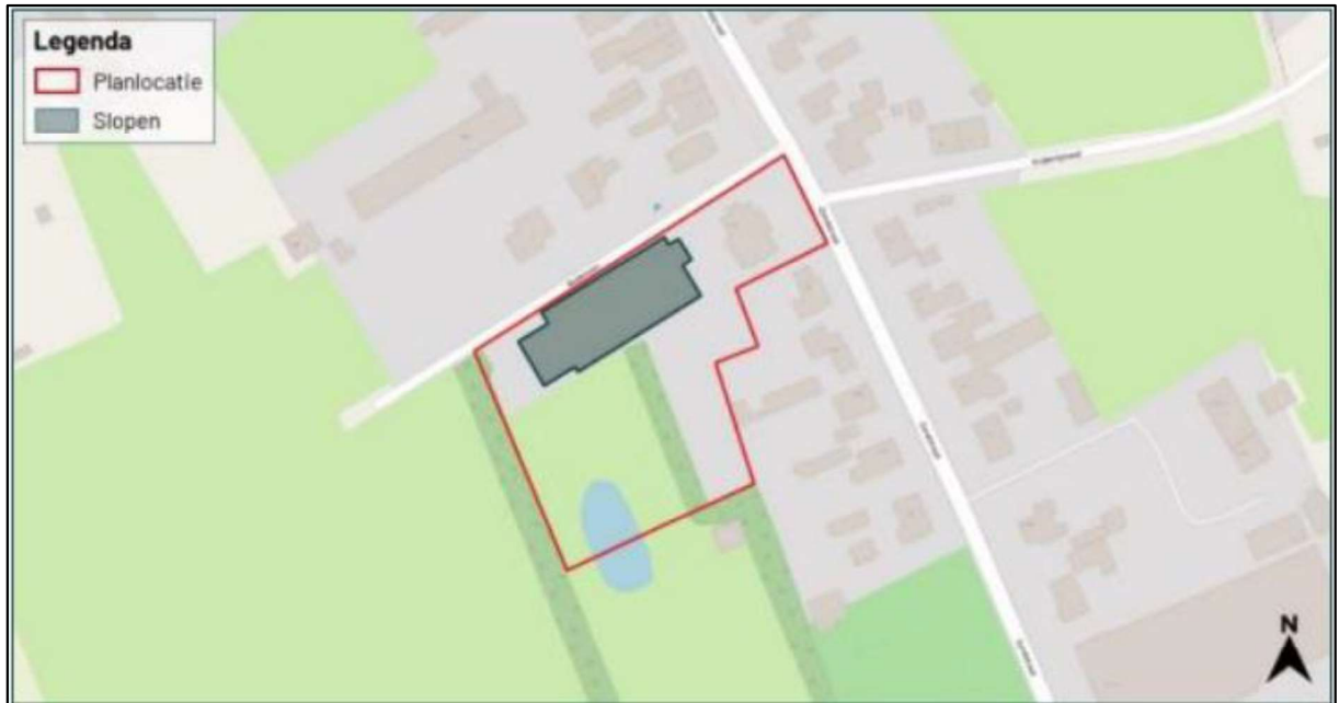
Figuur 1. Locatie Bodenvan 1, 5271 TJ te Sint-Michielsgestel. De activiteiten vinden plaats binnen het rood omlijnde gebied.