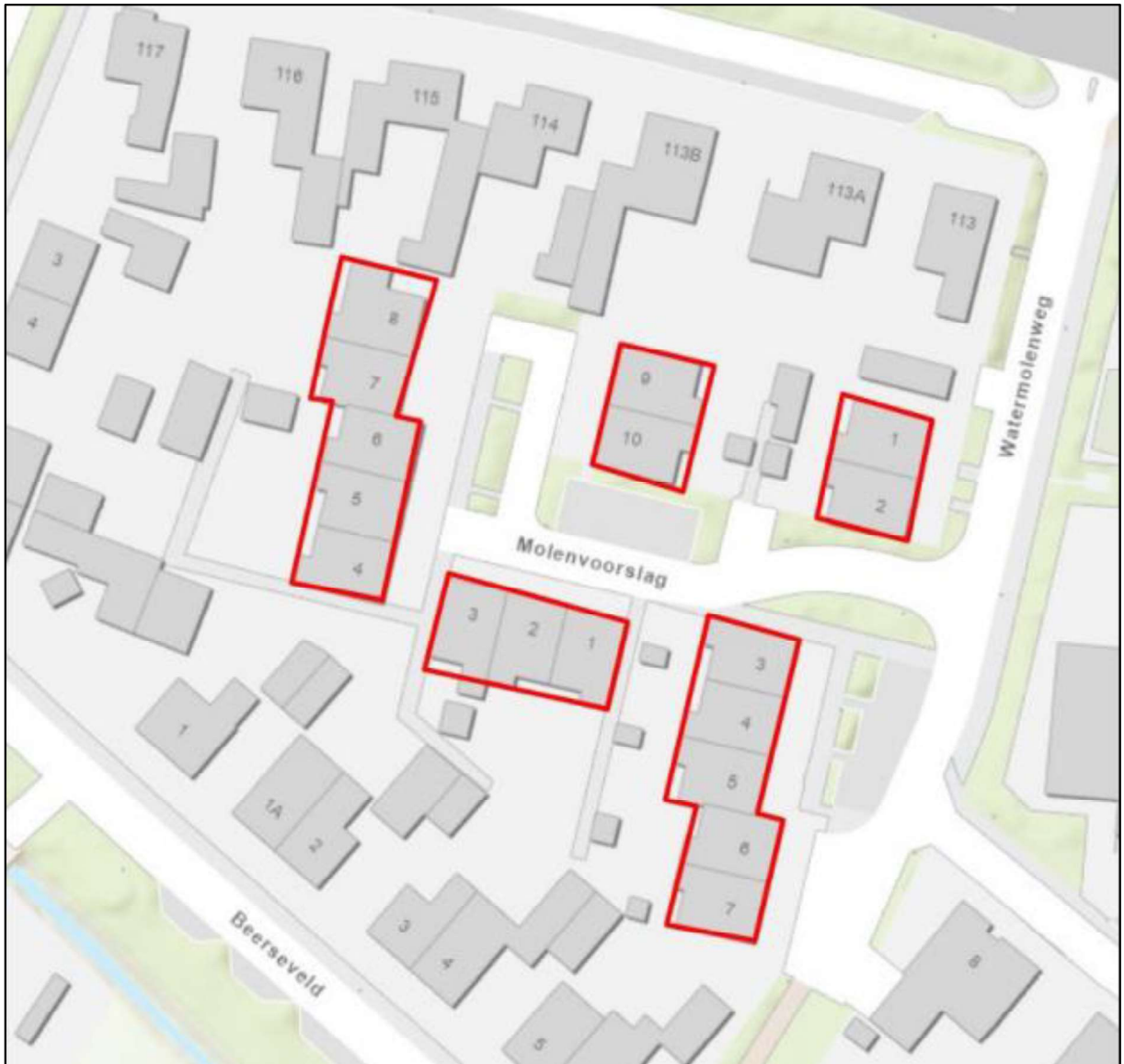
Figuur 3. Locatie: complex 3291. De activiteiten vinden plaats binnen de omliggende gebieden.