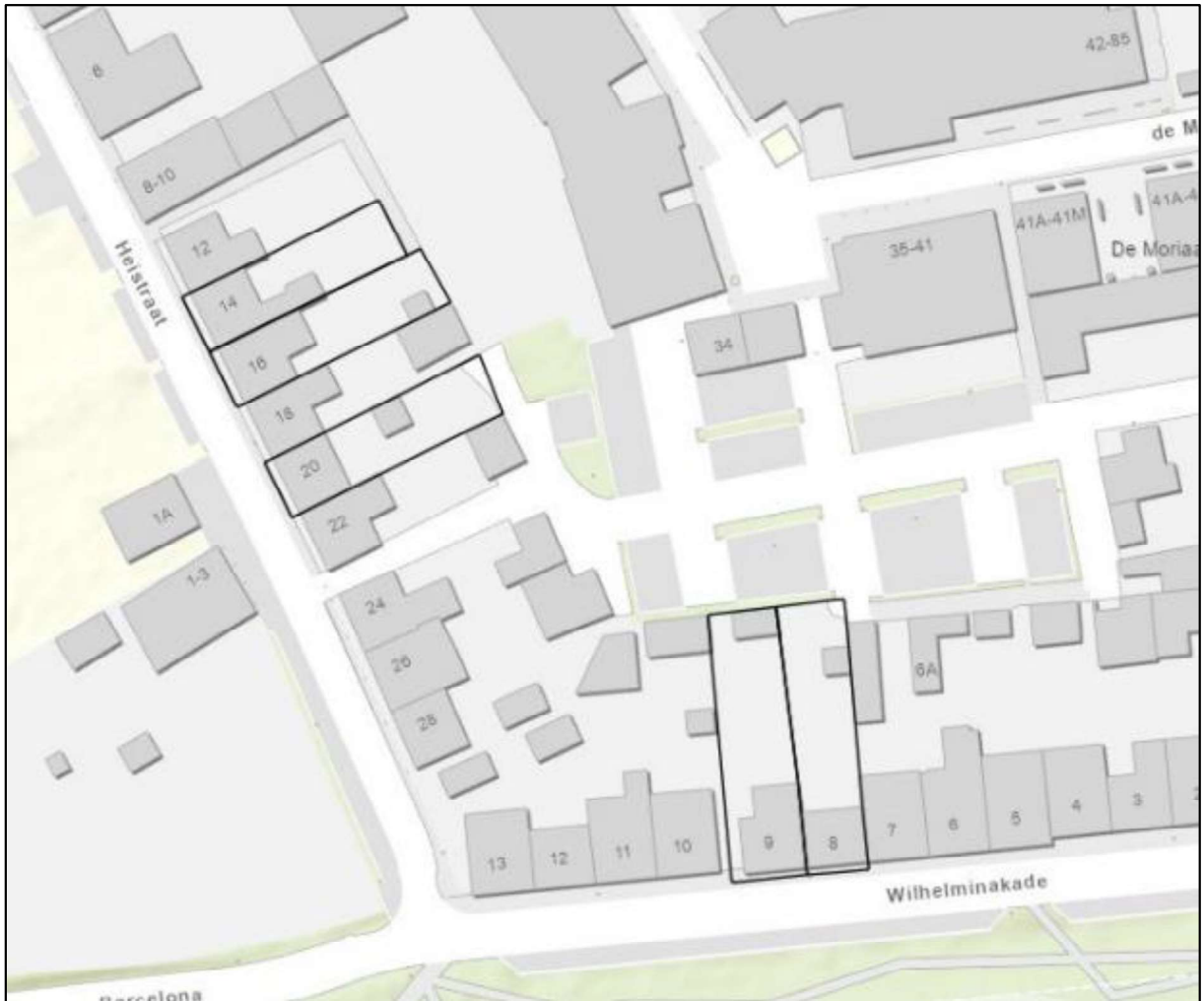
Figuur 2. Locatie: complex 3221 deelgebied 2. De activiteiten vinden plaats binnen de omliggende gebieden.