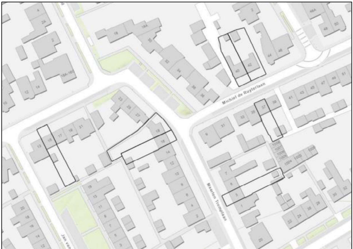
Figuur 1. Locatie: complex 3221 deelgebied 1. De activiteiten vinden plaats binnen de omliggende gebieden.