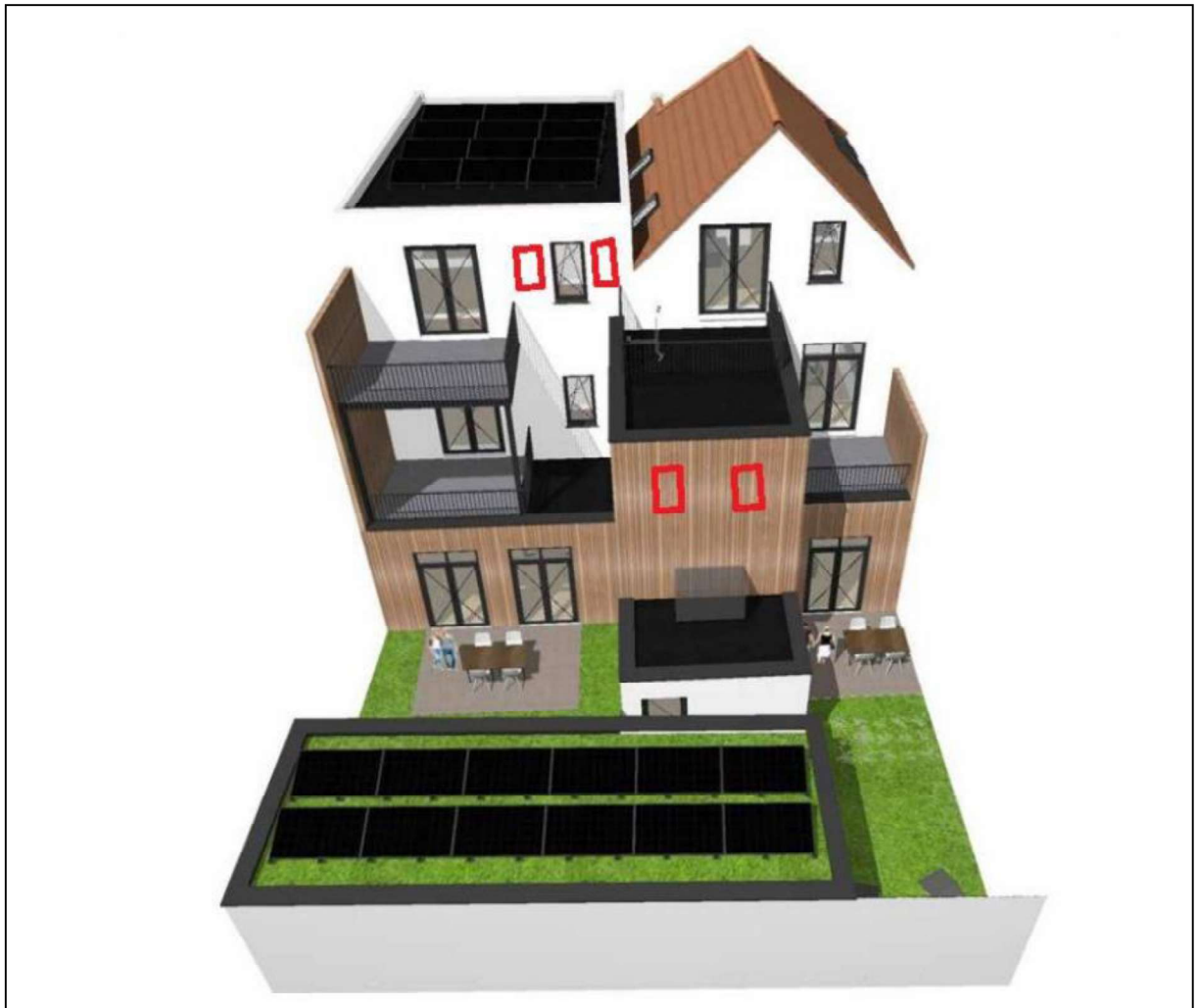
Figuur 3. Locatie van de permanente voorzieningen. Met inachtneming van voorschrift 23 en 24.