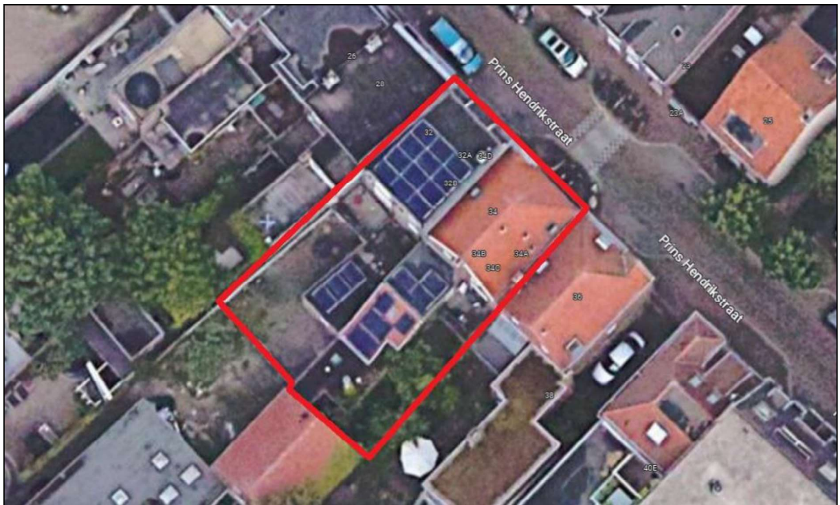
Figuur 1. Locatie Prins Hendrikstraat 32-34, 5611 HK te Eindhoven. De activiteiten vinden plaats binnen het omliggende gebied.